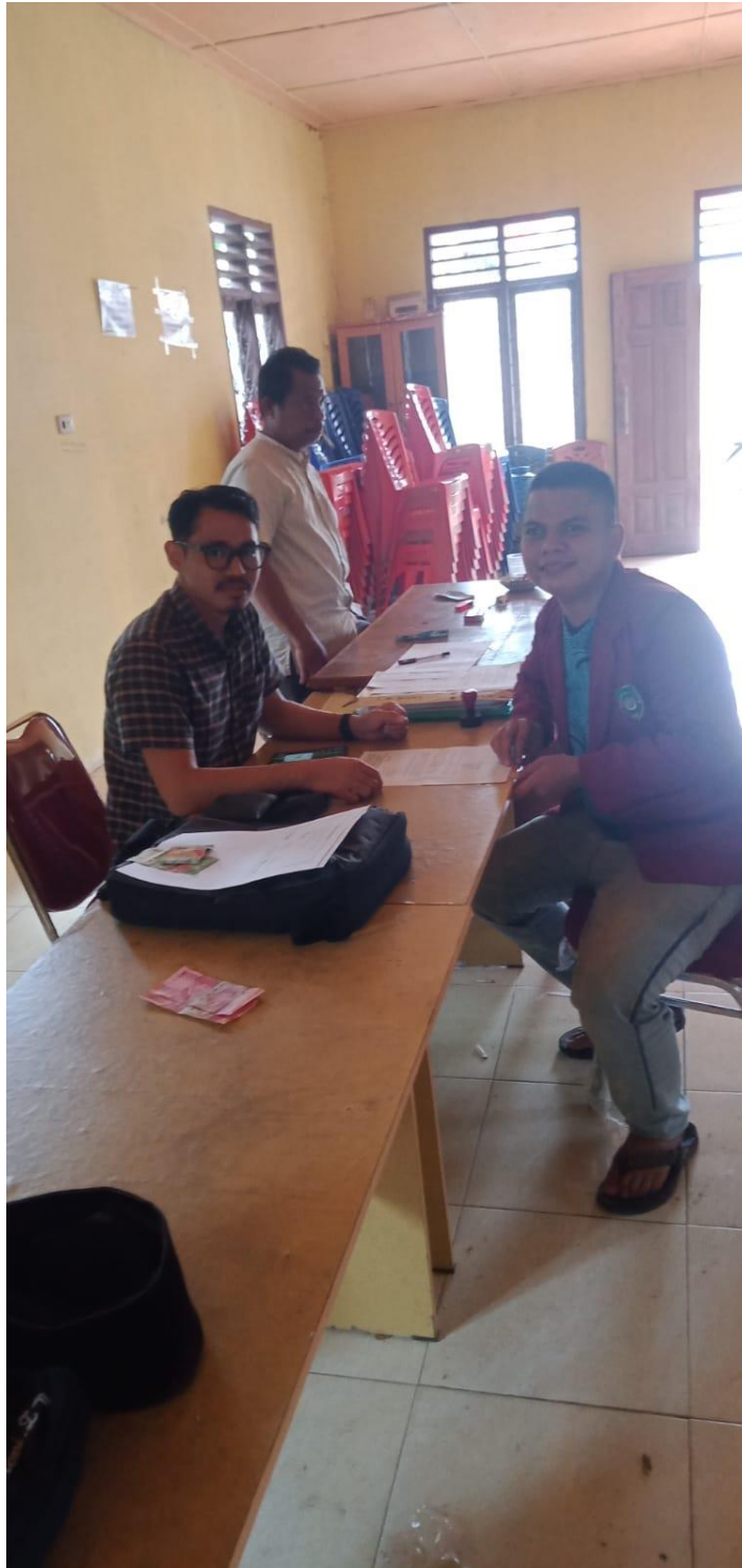
Foto bersama petugas kantor kepala desa Parmainan serah terima surat penelitian sekaligus melakukan wawancara mengenai usahatani kelapa sawit