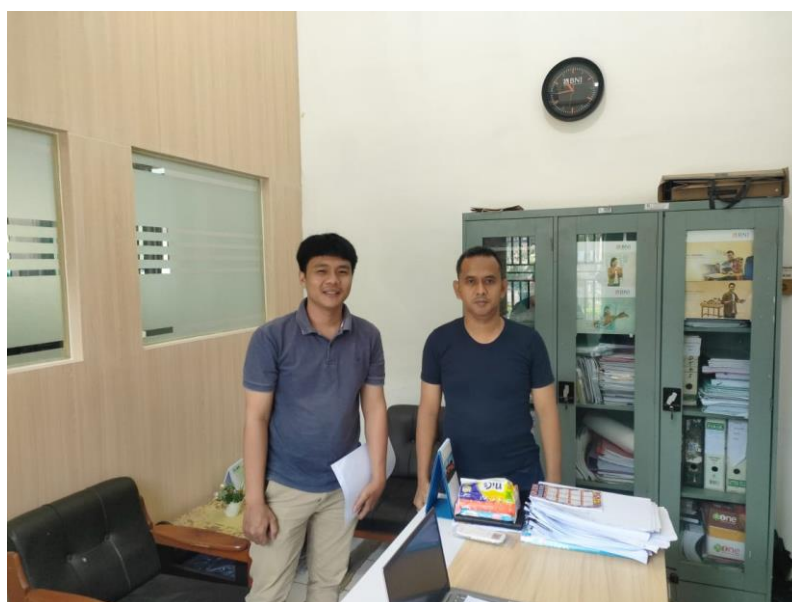
Wawancara dengan Kepala Bidang Penanganan Fakir Miskin Kabupaten Deli Serdang