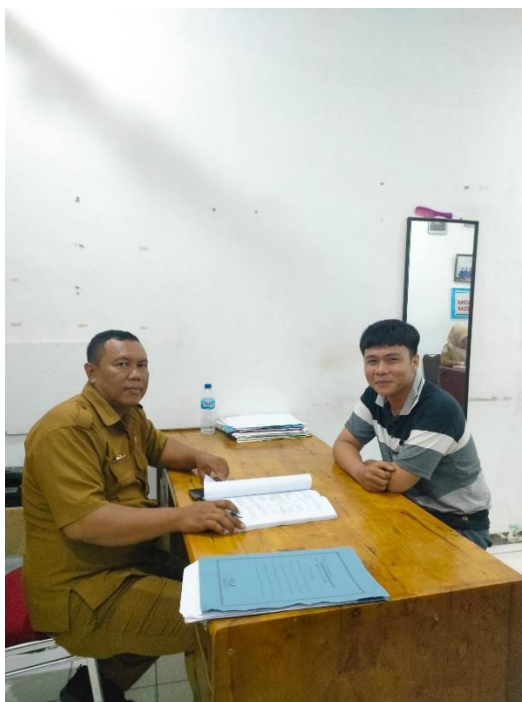
Wawancara dengan Kasi Kesejahteraan Sosial Kecamatan Tanjung Morawa