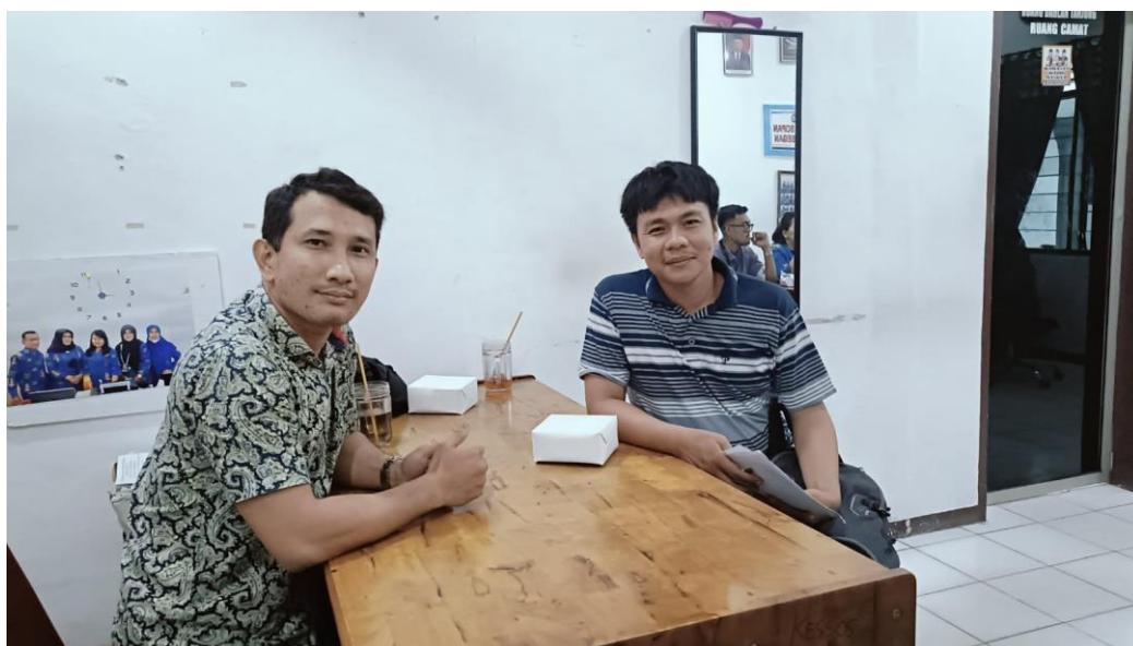
Wawancara dengan Koordinator PKM Kecamatan Tanjung Morawa