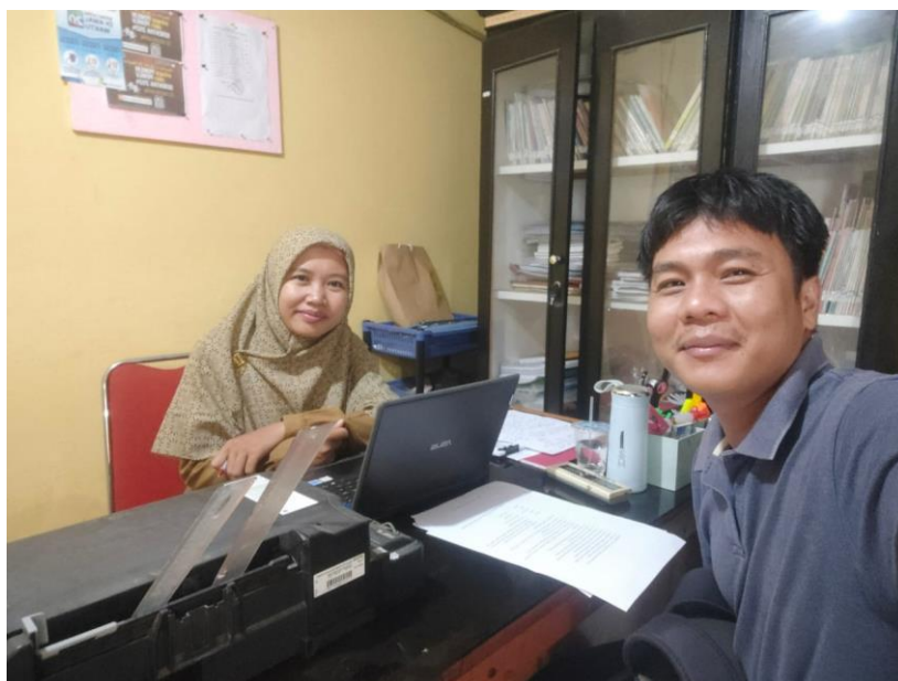
Wawancara dengan Sekretaris Desa Medan Sinembah