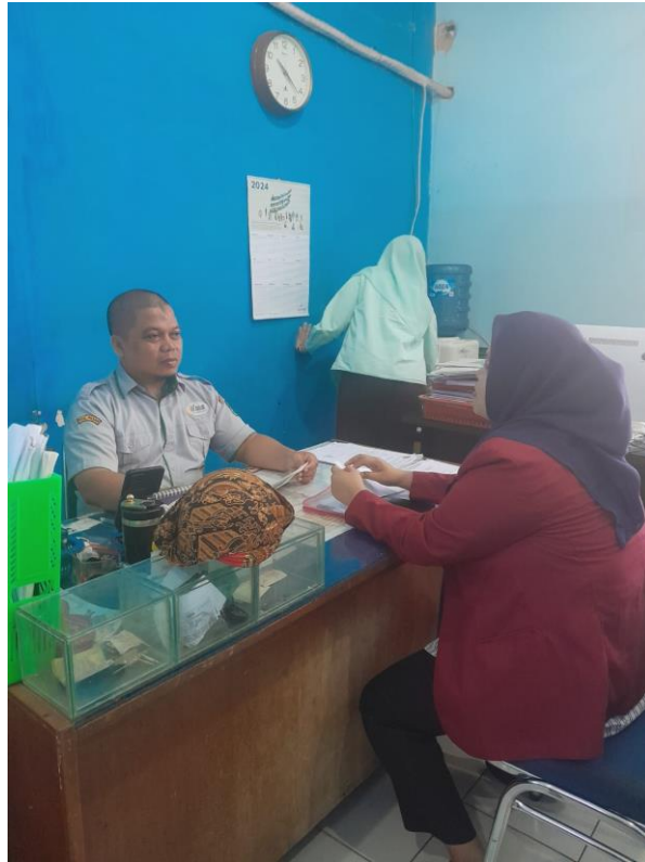
Lampiran 7 Wawancara Bersama Kabag Kepegawaian PUD Pasar