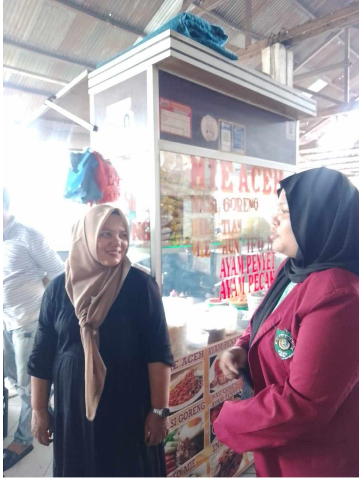
Lampiran 9 Wawancara PKL 2