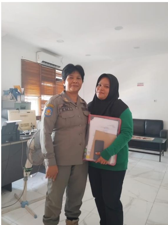
Lampiran 5 Wawancara Bersama Kabag Tribum Satpol PP