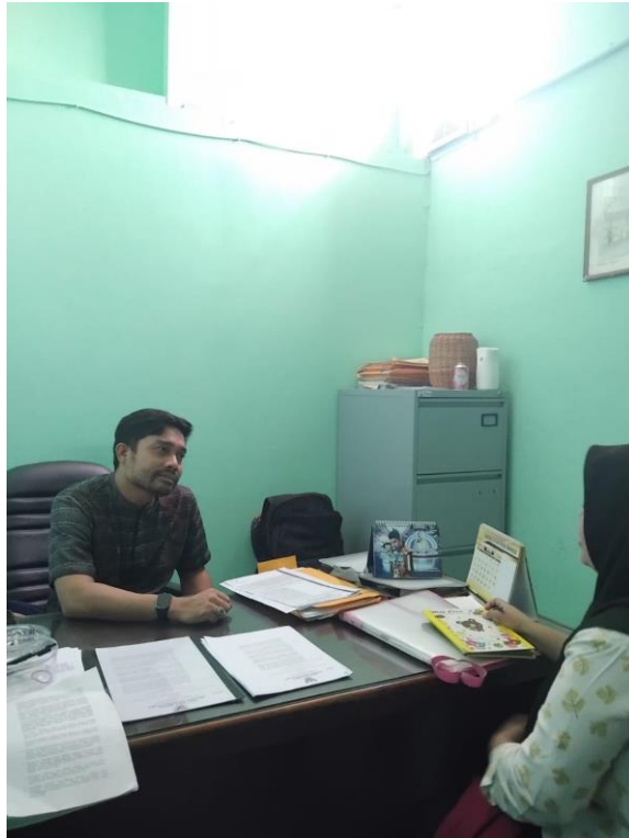
Lampiran 3 Wawancara Bersama Kebag Humas PUD Pasar