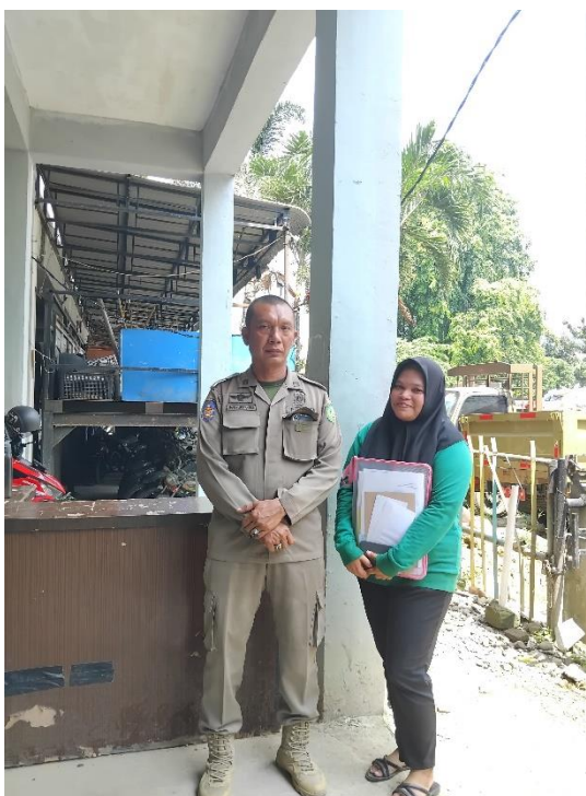
Lampiran 6 Wawancara Bersama Satpol PP