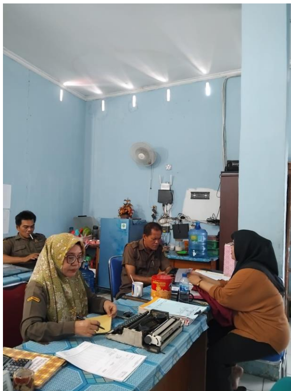
Lampiran 4 Wawancara Bersama Kepala Pasar Sukaramai