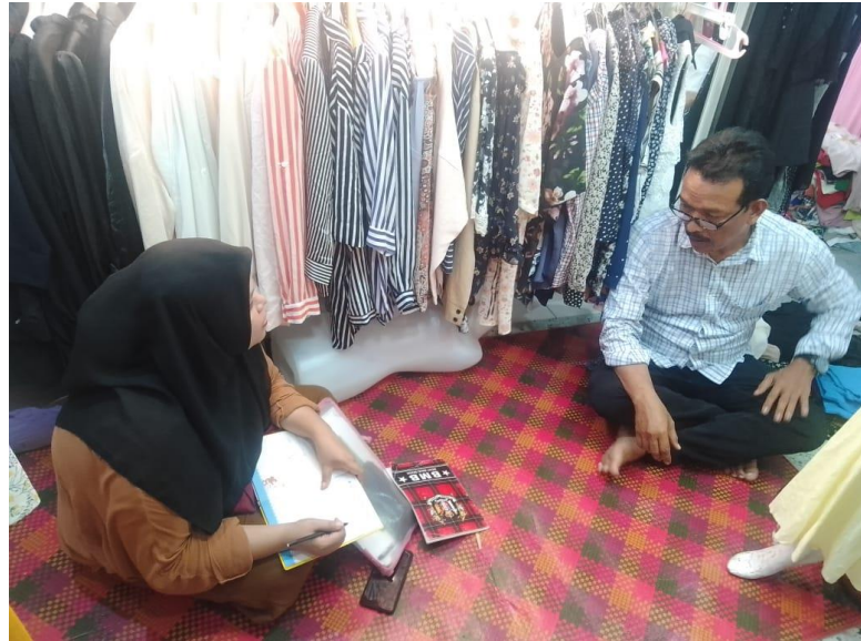
Lampiran 1 Wawancara Bersama Kepala Pasar Petisah