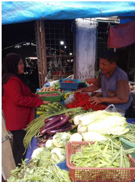
Lampiran 8 Wawancara PKL 1