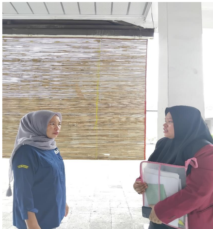
Lampiran 2 Wawancara Bersama Bagian Umum PUD Pasar