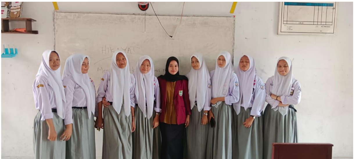
Lampiran 4. Dokumentasi Kegiatan Kelas X Manajemen Perkantoran dan Layanan Bisnis (MPLB) 3