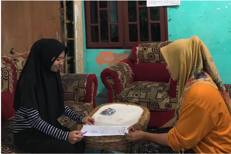
Pemberian Surat penyelesaian penelitian dari ibu kepala desa