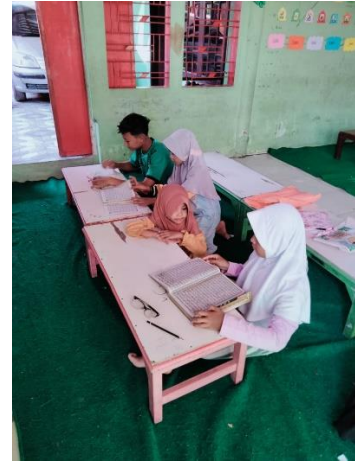
(Situasi Anak Yang Mengaji)