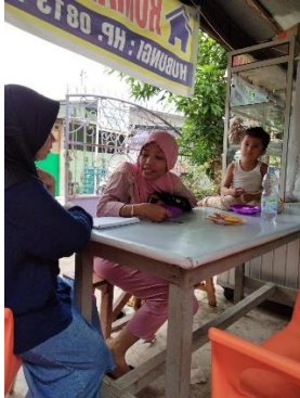
(Wawancara Dengan Ibu Ummu)