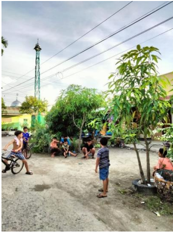
(Situasi Lingkungan Anak Bermain)