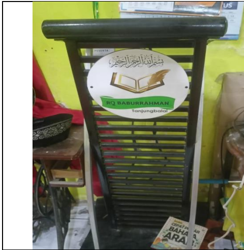
Podium Acara Rumah Qur'an