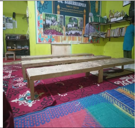
Kelas Rumah Qur'an Baburrahman