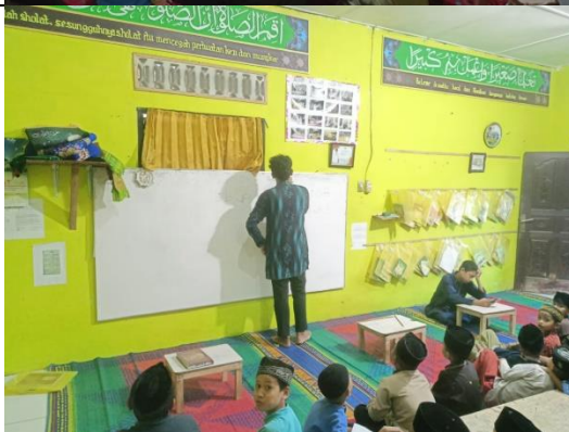
Metode Tajwid Terpusat