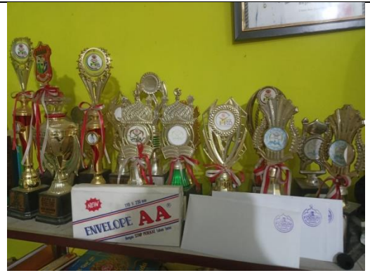
Prestasi Santri/Santriwati Rumah Qur'an Baburrahman