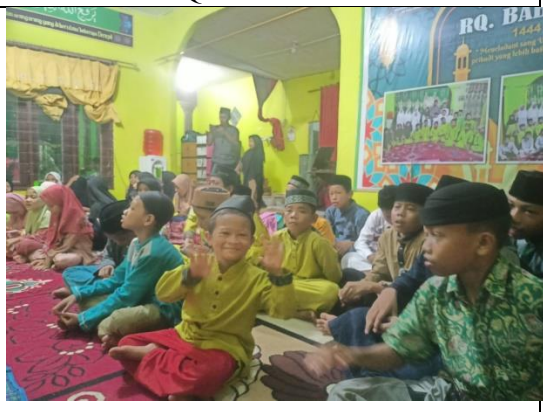
Santri/santriwati Rumah Qur'an Baburrahman Kelas Malam