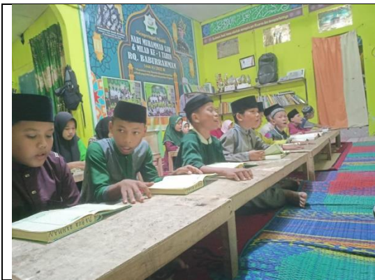
Metode Baca Bersama