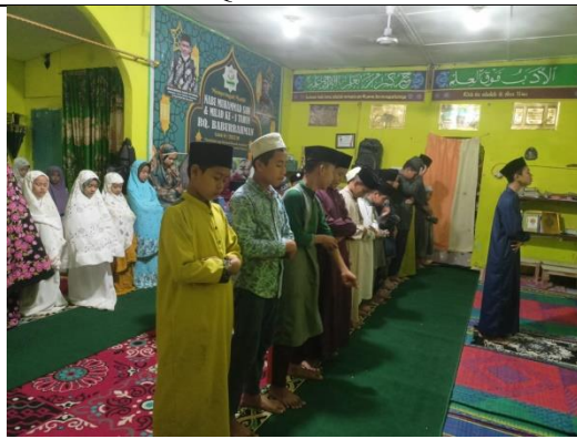
Kegiatan Sholat Santri/Santriwati Rumah Qur'an Baburrahman