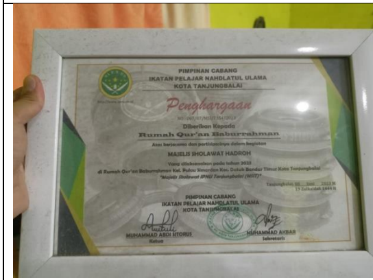
Penghargaan dari Ikatan Pelajar Nahdhatul Ulama : Majelis Sholawat Hadroh