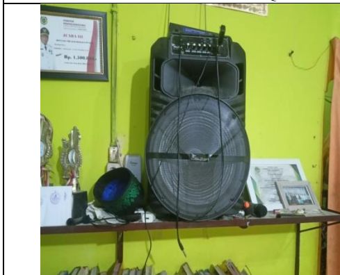
Media Pembelajaran Rumah Qur'an Baburrahman