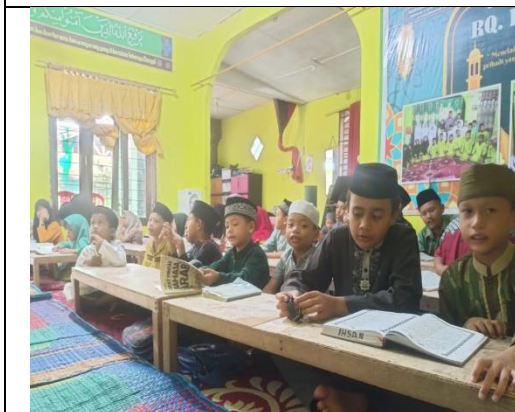
Santri/santriwati Rumah Qur'an Baburrahman Kelas Sore