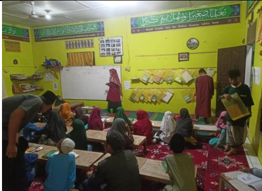
Metode Tajwid Terpusat