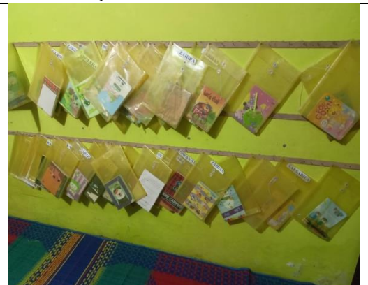
Kumpulan Buku Tulis Santri/Santriwati Rumah Qur'an Baburrahman