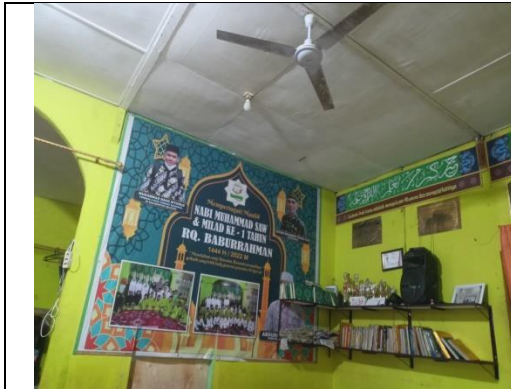
Kondisi Rumah Qur'an Baburrahman