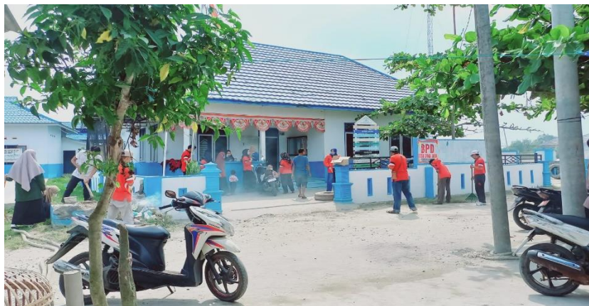
Gambar 2. Kantor Desa Suka Jaya