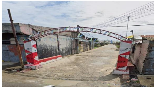
Gambar 3. Lokasi Penelitian