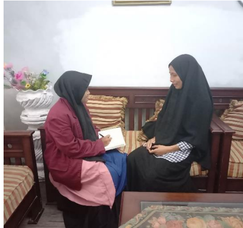
Wawancara Dengan Ibu iin