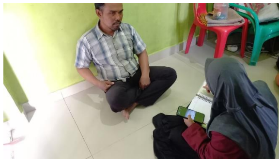
Wawancara Dengan Bapak Sapiik