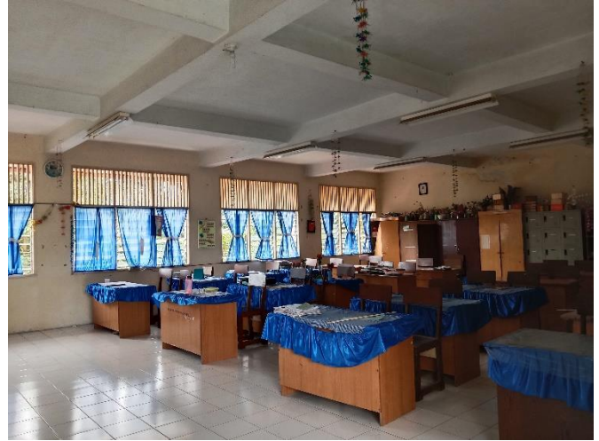
Gambar 10. Ruang Guru Sekolah YAPIM Namorambe