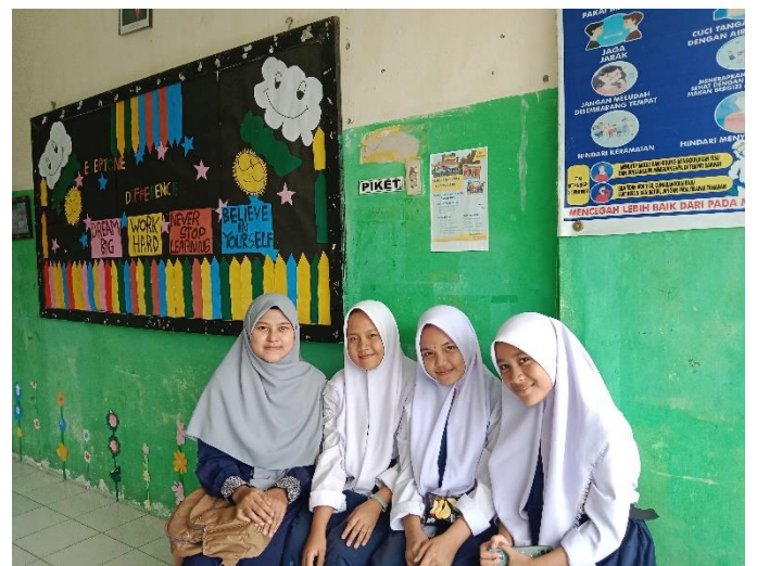
Gambar 04. Wawancara dengan Peserta Didik Kelas VII