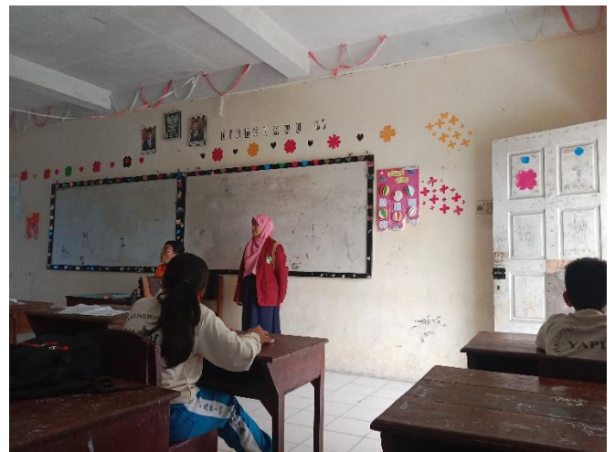
Gambar 12. Observasi di Ruang Kelas