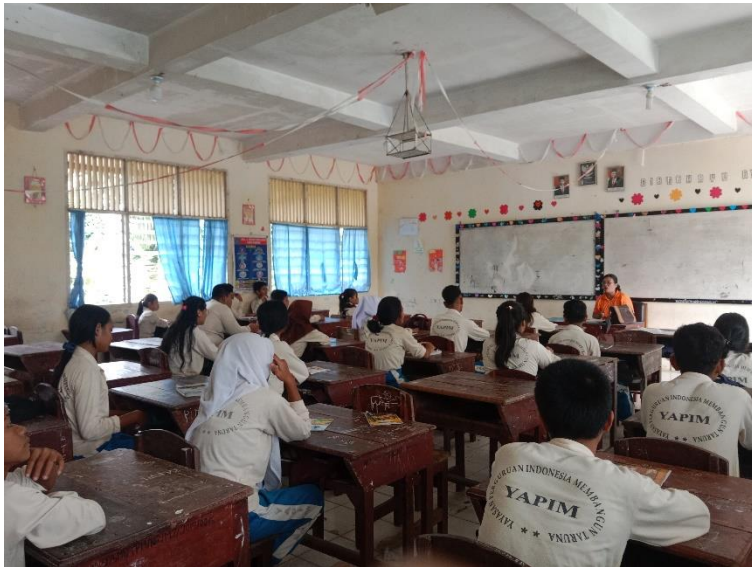
Gambar 11. Ruang Kelas VIII