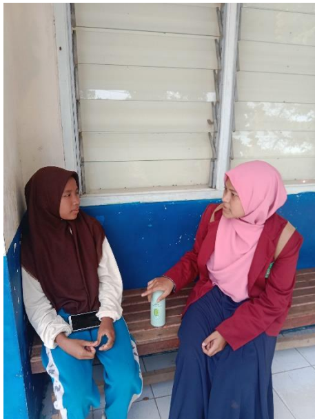
Gambar 07. Wawancara dengan Peserta Didik Kelas VII