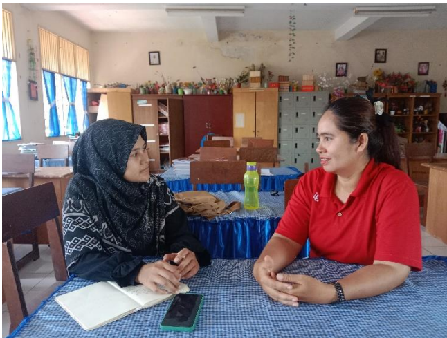
Gambar 03. Wawancara dengan Guru PKN