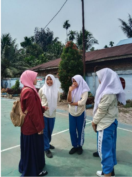
Gambar 05. Wawancara dengan Peserta Didik Kelas VIII