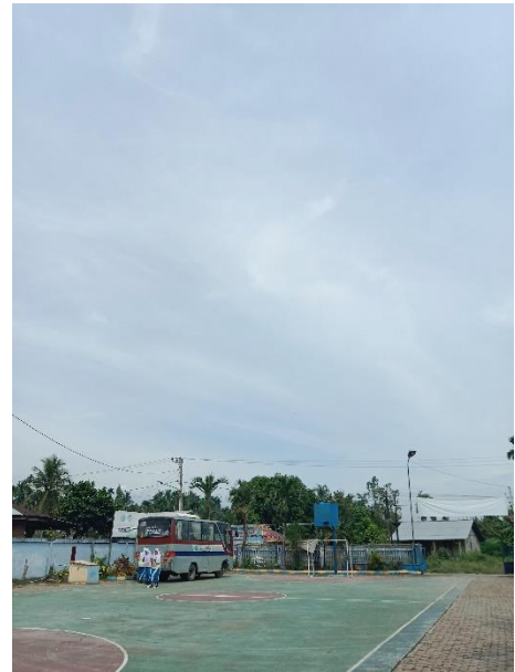
Gambar 06. Lapangan dan Bus Sekolah YAPIM Namorambe