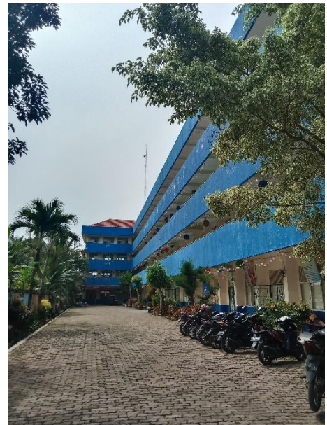
Gambar 08. Bangunan Sekolah YAPIM Namorambe