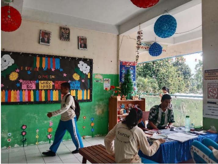
Gambar 09. Ruang Piket Sekolah YAPIM Namorambe