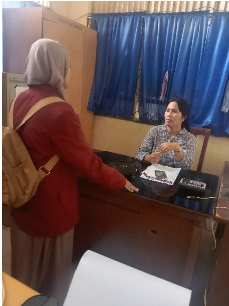
Gambar 01. Wawancara dengan Kepala Sekolah SMP YAPIM Namorambe