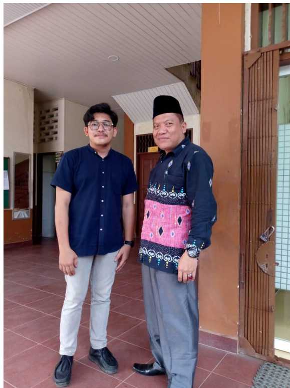
Gambar 3.2 Dokumentasi Dari Sekolah Yayasan Taman Pendidikan Islam