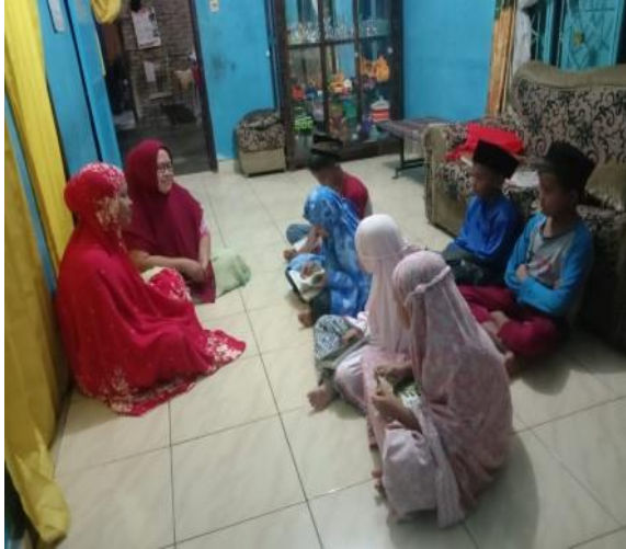
Foto Kegiatan TPA