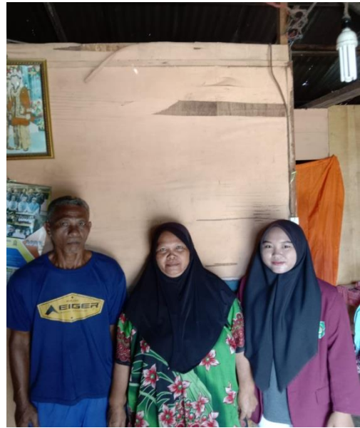
Foto Bersama Orang Tua