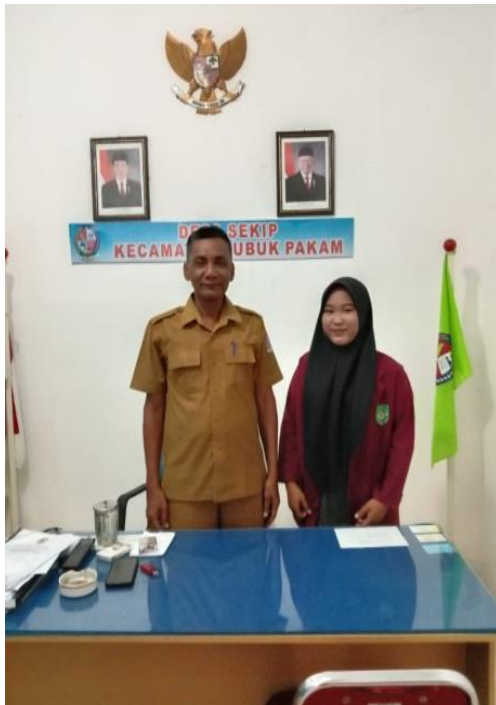
Foto Bersama Kepala Desa