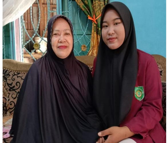
Foto Bersama Tokoh Agama