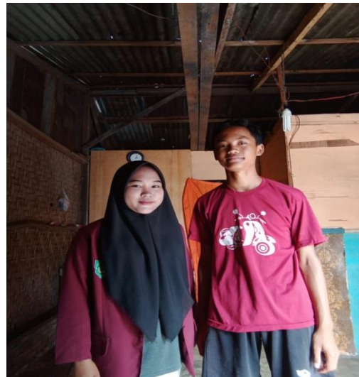
Foto Bersama Remaja