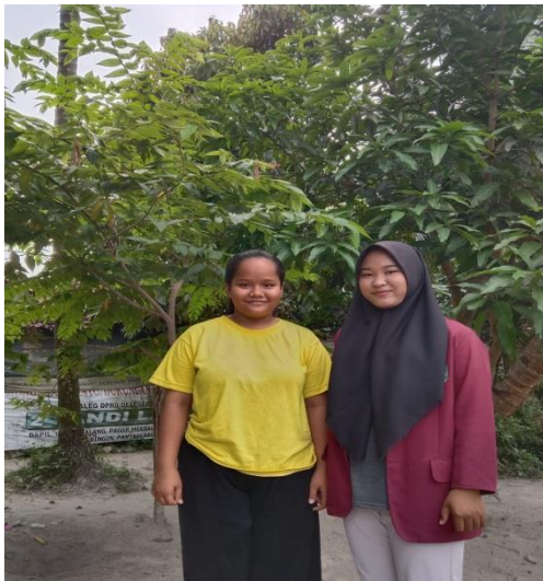
Foto Bersama Remaja