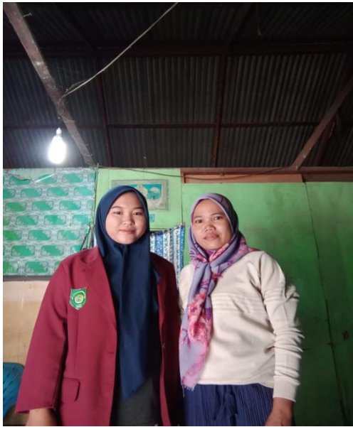
Foto Bersama Orang Tua