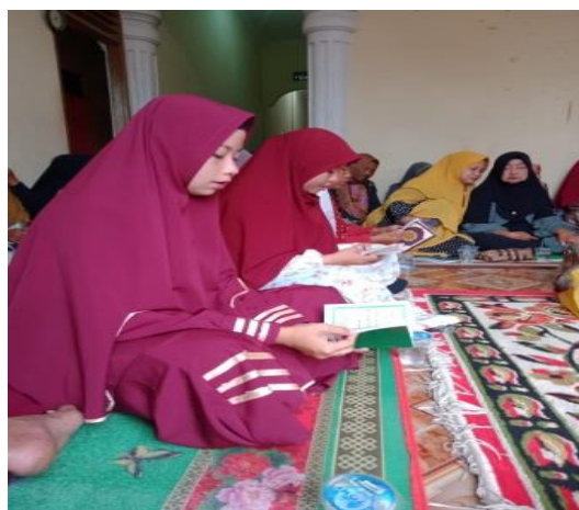
Foto Kegiatan Pengajian