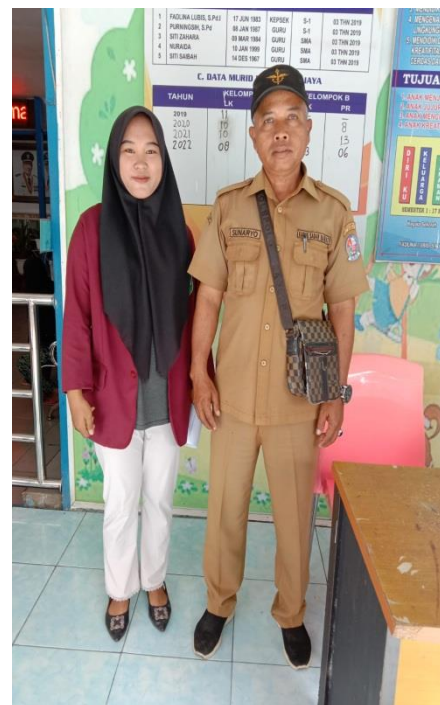
Foto Bersama Tokoh Masyarakat