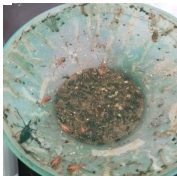
Gambar 5. Imago sempurna atau imago aplikasi