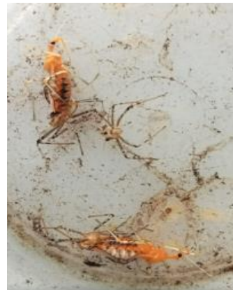
Gambar 4. Perubahan ecdysis dari nimfa menjadi imago