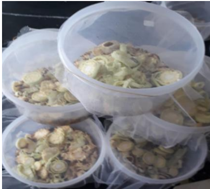
Gambar 1. Pemberian makan larva S. frugiperda hingga menjadi pupa