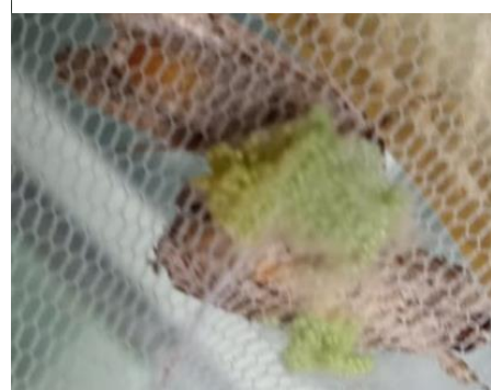
Gambar 4. Imago meletakkan telurnya