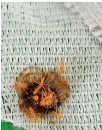
Gambar 3. Penetasan telur menjadi nimfa