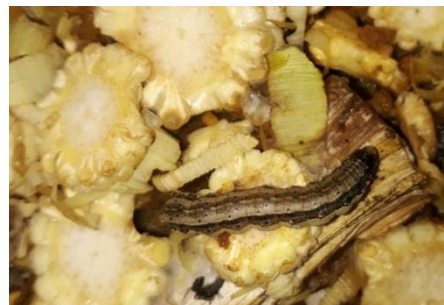
Gambar 6. Larva instar 3 siap untuk aplikasi