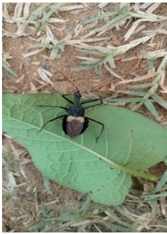
Gambar 1. Pengambilan Predator Sycanus dichotomus