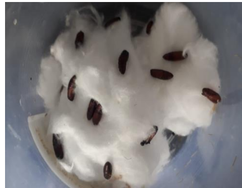
Gambar 2. Pupa S. frugiperda hingga menjadi imago