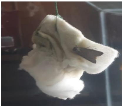
Gambar 3. Imago menghisap madu yang ada di kapas untuk kebutuhan hidup