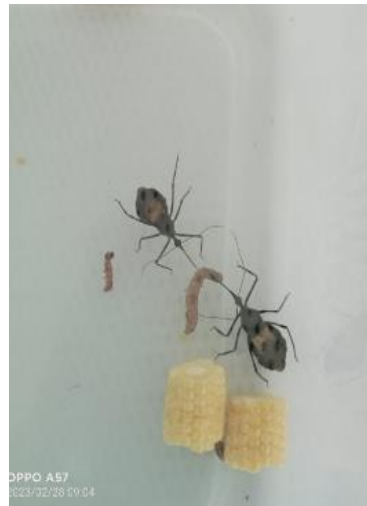
Gambar 7. Daya Predasi predator