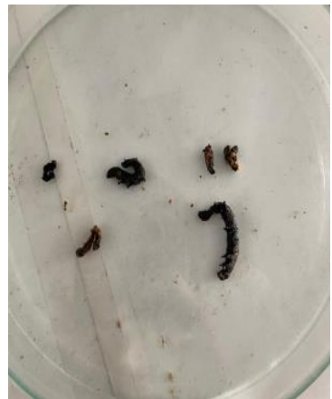
Gambar 9. Kumpulan S. frugiperda yang sudah di predasi predator