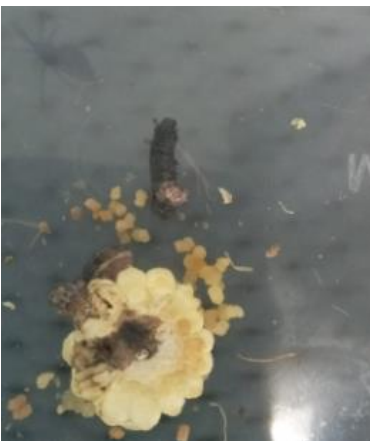
Gambar 8. Gejala sesudah di predasi predator