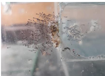
Gambar 5. Penetasan telur menjadi larva S. frugiperda