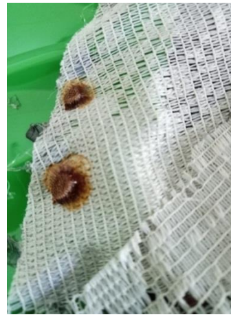
Gambar 2. Telur Sycanus dichotomus