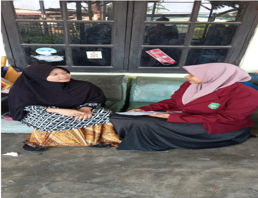
Wawancara dengan anggota Ikatan Remaja Masjid Silaturrahim