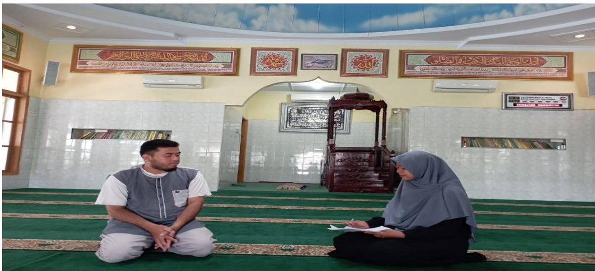
Wawancara dengan Ketua Ikatan Remaja Masjid Silaturrahim