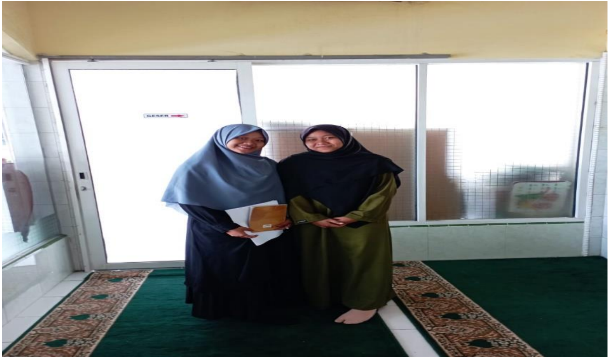
Wawancara Dengan Bendahara Ikatan Remaja Masjid Silaturrahim