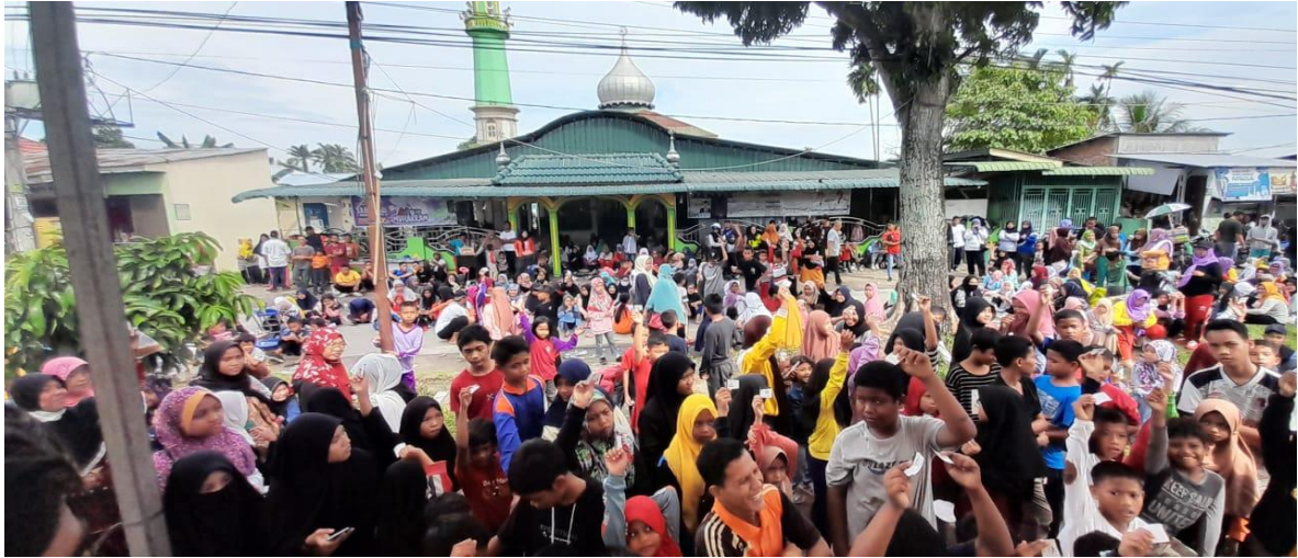
Kegiatan Muharam bersama masyarakat Sari Rejo dengan membuat kegiatan gerak jalan