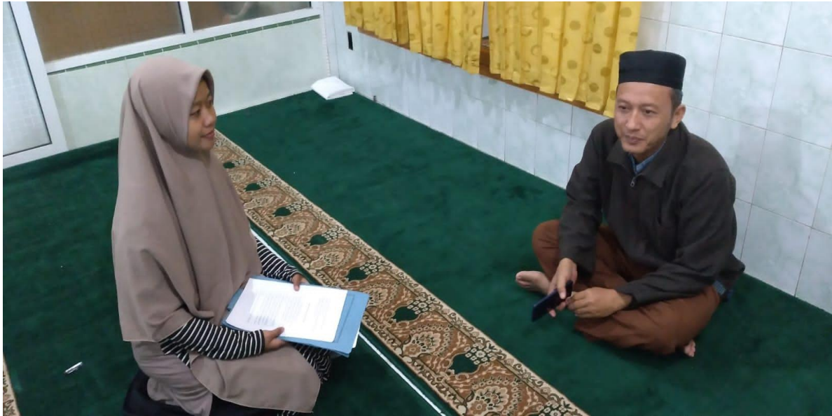
Wawancara dengan Pembina Ikatan Remaja Masjid Silaturrahim