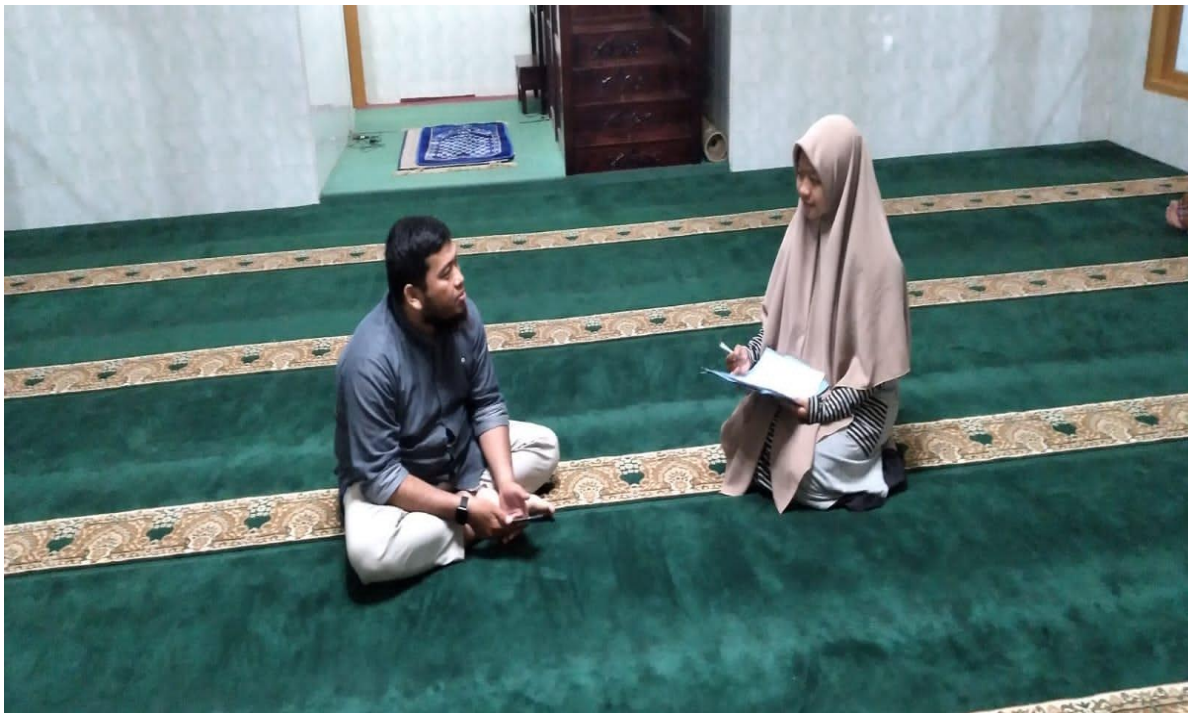
Wawancara dengan Bendahara Badan Kemakmuran Masjid Silaturrahim