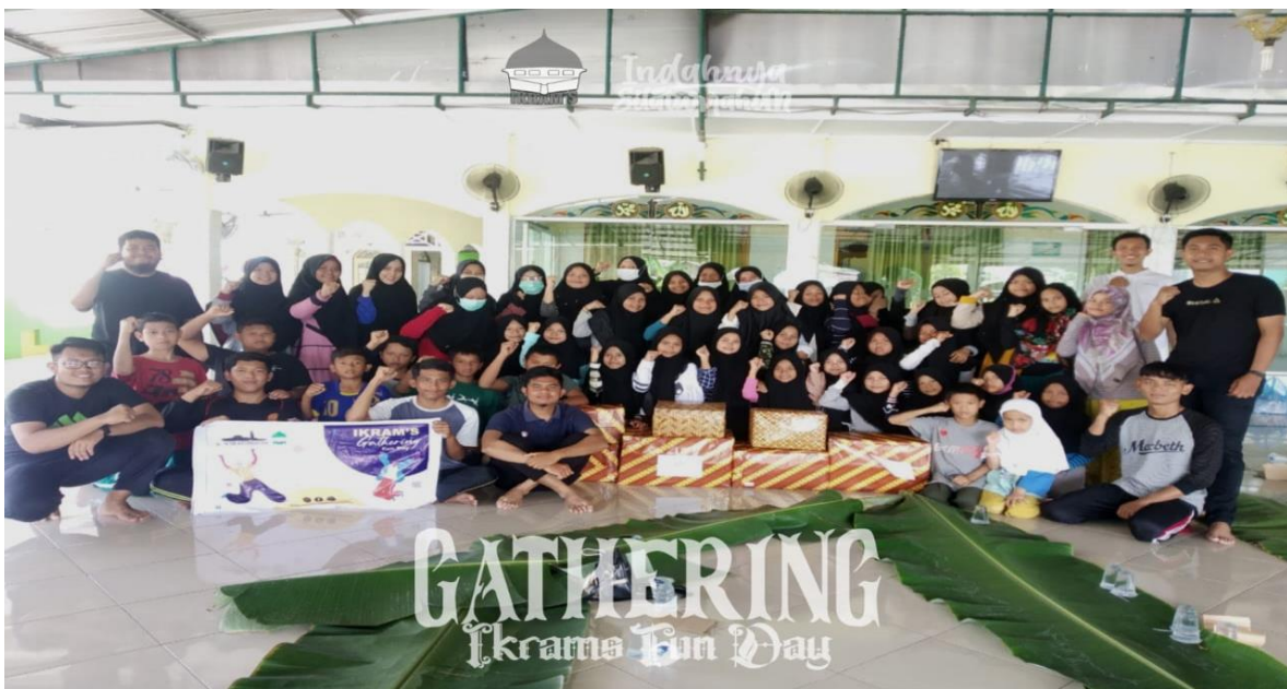
Kegiatan Gathering dalam rangka perekrutan anggota baru