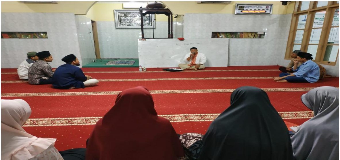
Pengajian Remaja Masjid di Kelurahan Sari Rejo Kecamatan Medan Polonia