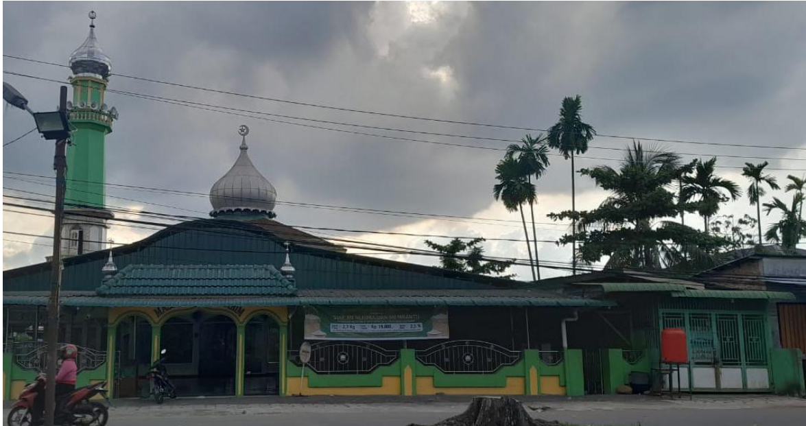
Lokasi Masjid Silaturrahim No.64 Kelurahan Sari Rejo Kecamatan Medan Polonia