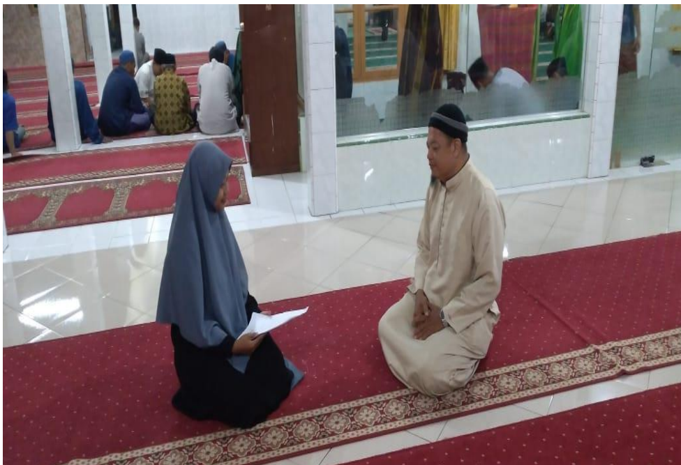
Wawancara dengan ketua Badan Kemakmuran Masjid Silaturrahim