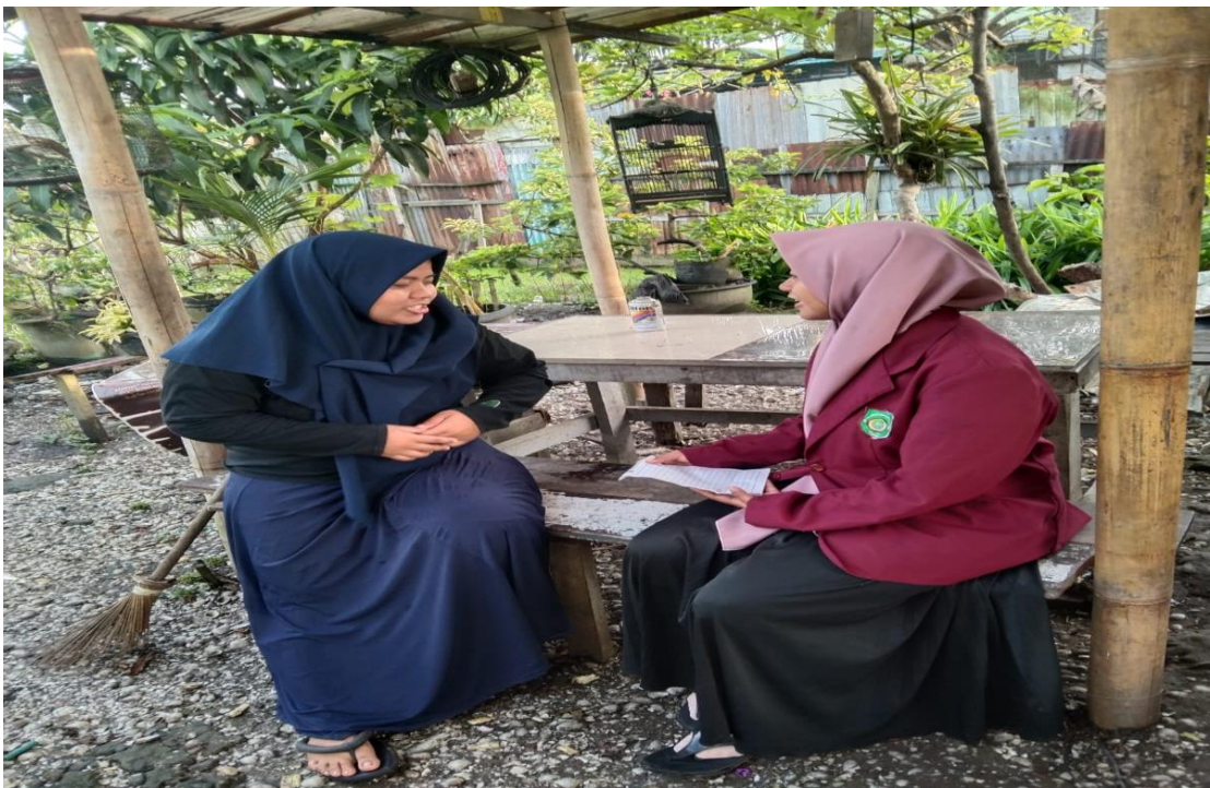
Wawancara dengan sekretaris Ikatan Remaja Masjid Silaturrahim