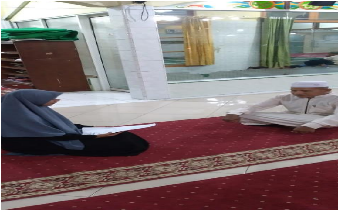
Wawancara dengan Bendahara Badan Kemakmuran Masjid Silaturrahimm