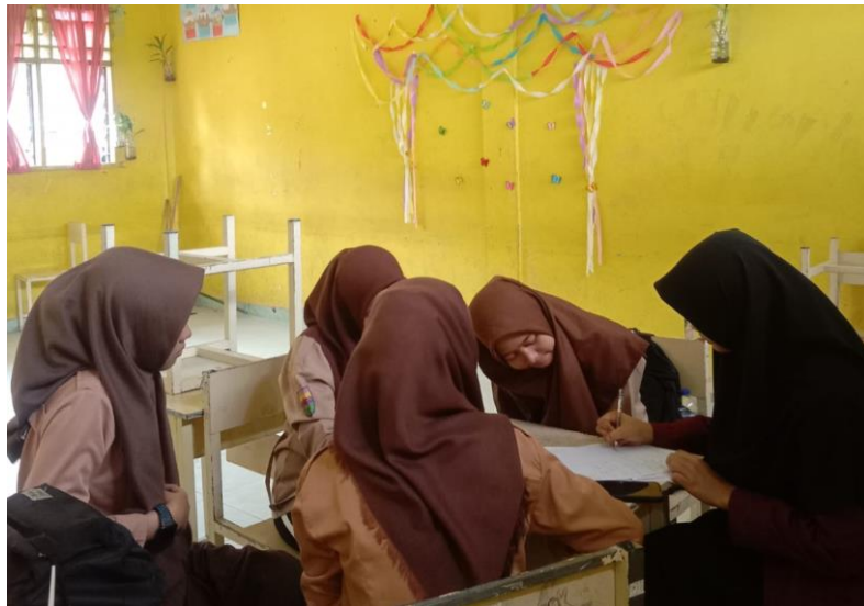
(suasana wawancara siswa diruangan kelas XI Akuntansi, Ketika jam pulang sekolah )