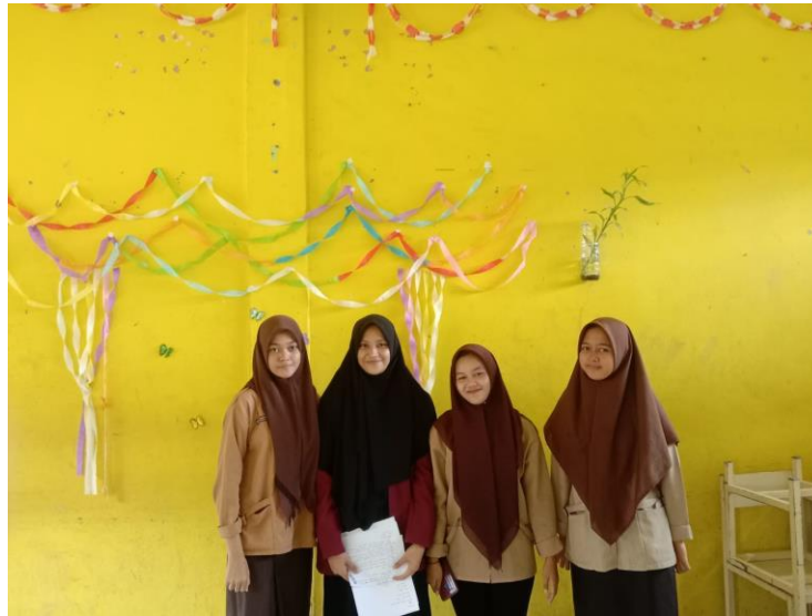
(suasana foto bersama diruangan kelas XI Akuntansi, Ketika selesai mewawancarai siswa )