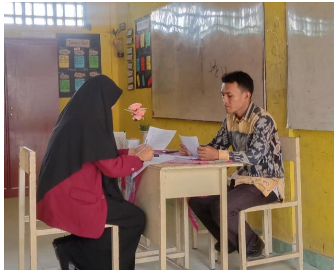
FOTO DOKUMENTASI WAWANCARA GURU DAN SISWA DI KELAS XI AKUNTANSI SMK TELADAN SEI RAMPAH

(10 Februari 2023, suasana wawancara guru PAI diruangan kelas XI Akuntansi, Ketika jam pulang sekolah )