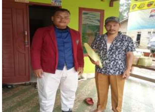
5. Foto Bersama Kepala Dusun I Rumah Gerat Rumah