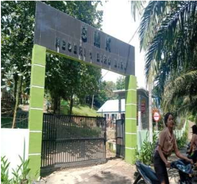
SMK NEGERI 1 BIRU-BIRU