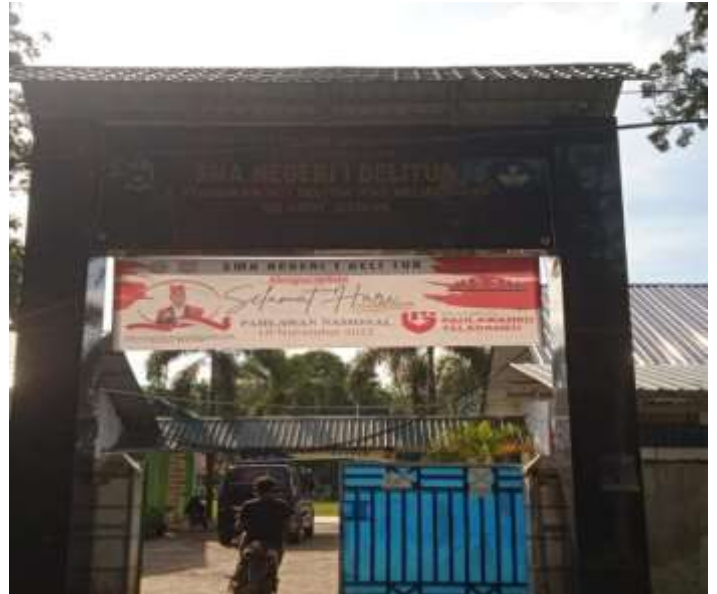
SMA NEGERI 1 DELI TUA