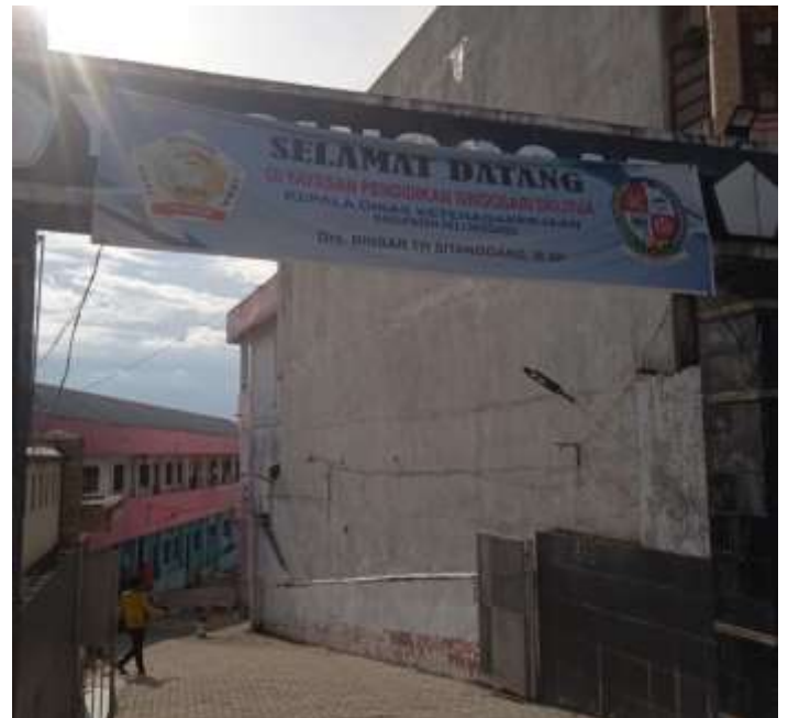
SMA SINGOSARI DELI TUA