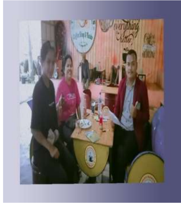
Ibu Esra dan Anak