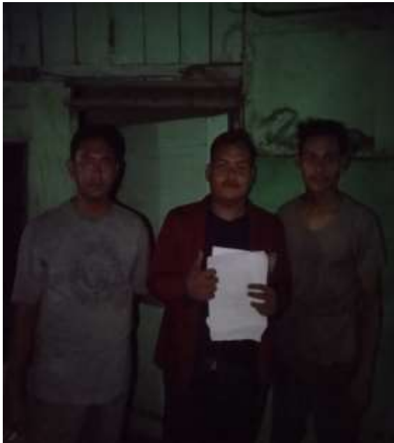
Bapak Ariya dan Anak