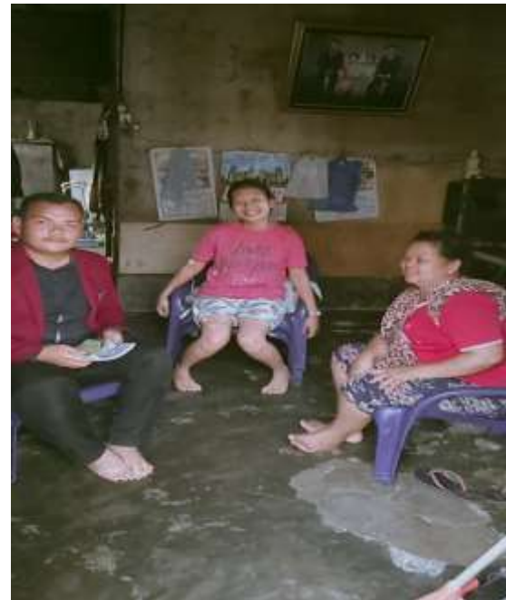
Ibu Maharani dan anak