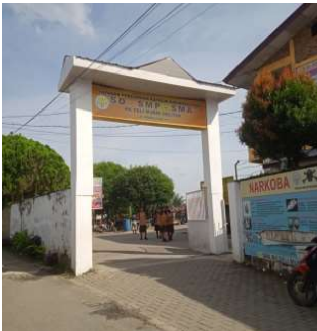
SMA YPK DELI MURNI DELITUA