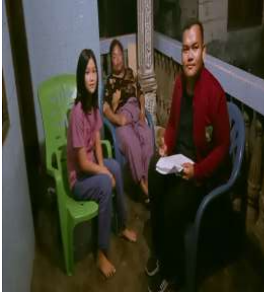
Ibu Elbina dan Anak