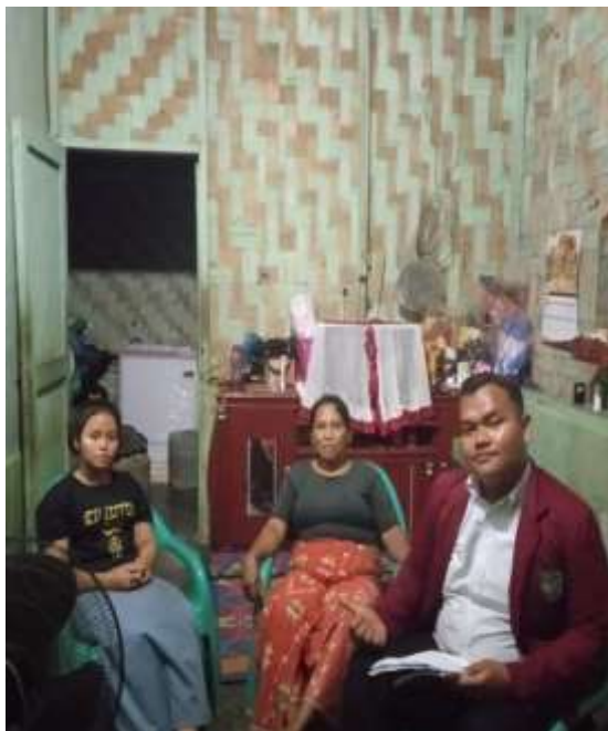
Ibu Cristina dan Anak