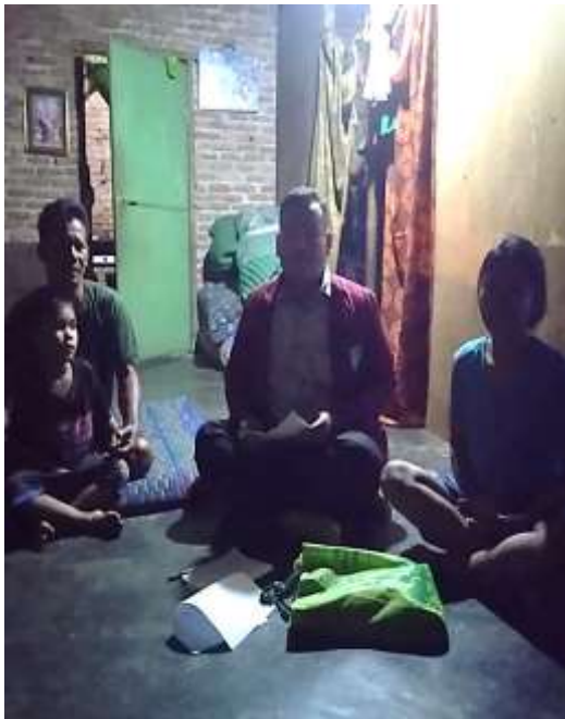
Bapak Robinson dan Anak