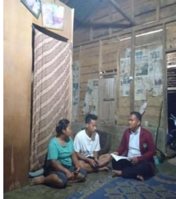
Ibu Vera dan anak