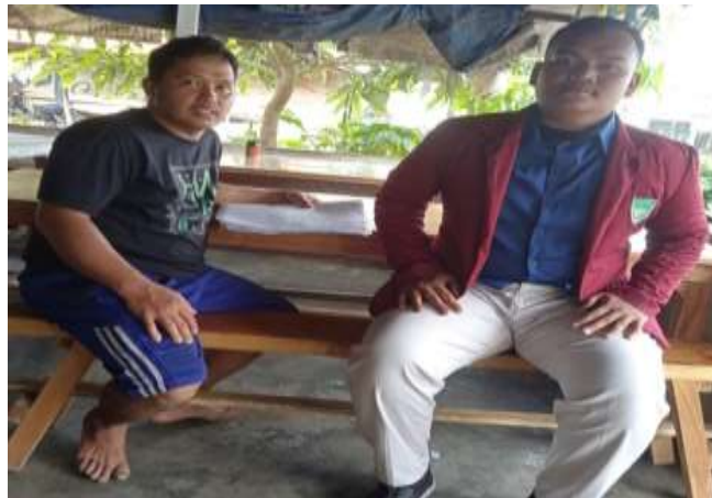
6. Foto Bersama Kepala Dusun V Ujung Teran