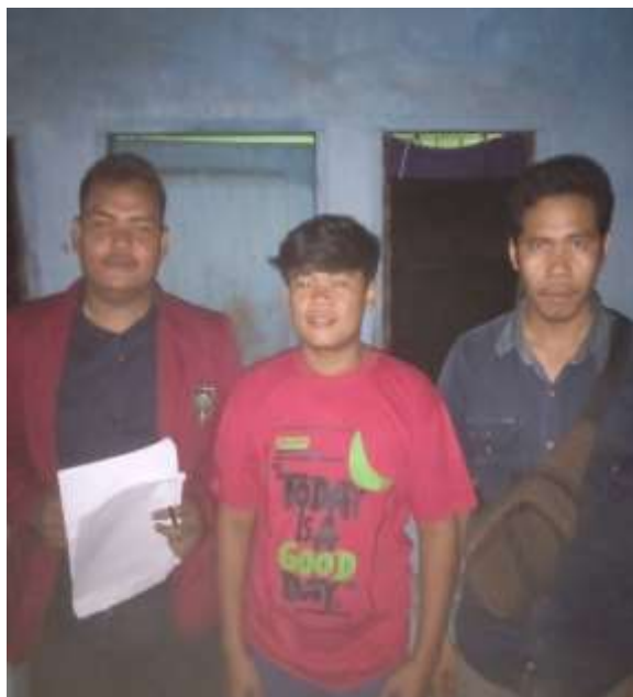
Bapak Toyo dan Anak