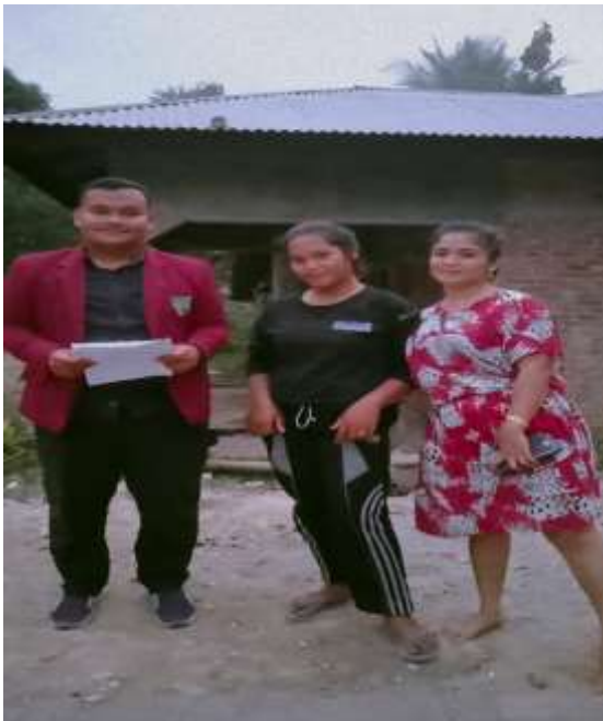
Ibu Martini dan Anak