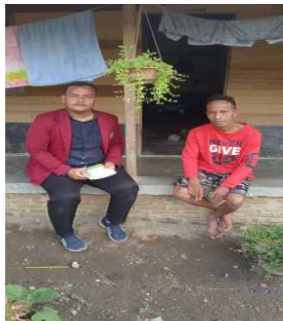
Bapak Antoni dan Anak