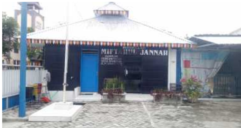
Gambar : Musholla Kantor Desa Sei Rotan