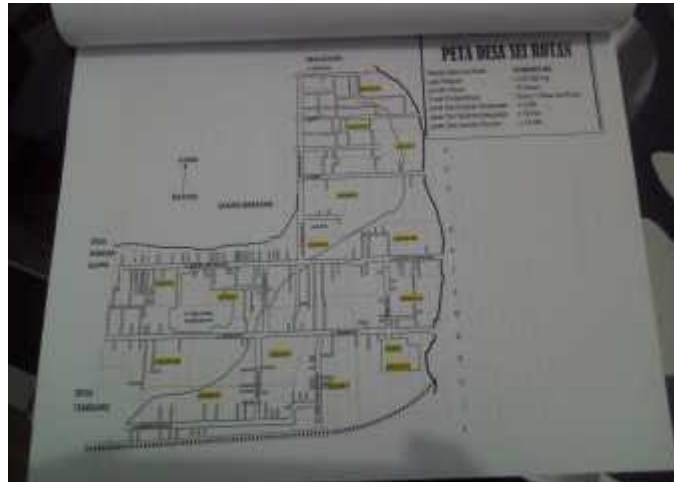
Gambar : Peta Desa Sei Rotan