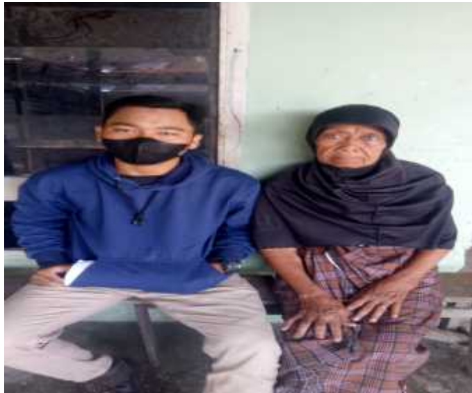
Gambar : Wawancara dengan masyarakat penerima BPNT