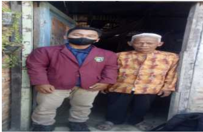
Gambar : Wawancara dengan penerima BPNT