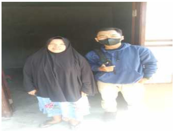
Gambar : Wawancara dengan masyarakat penerima BPNT