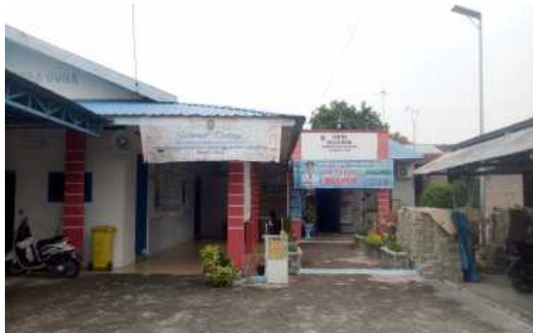
Gambar : Kantor Desa Sei Rotan