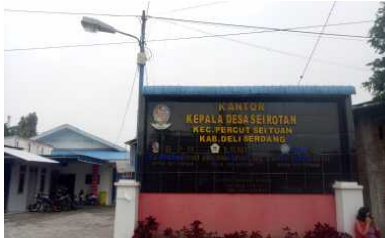
Gambar : Tampak Depan Kantor Desa Sei Rotan