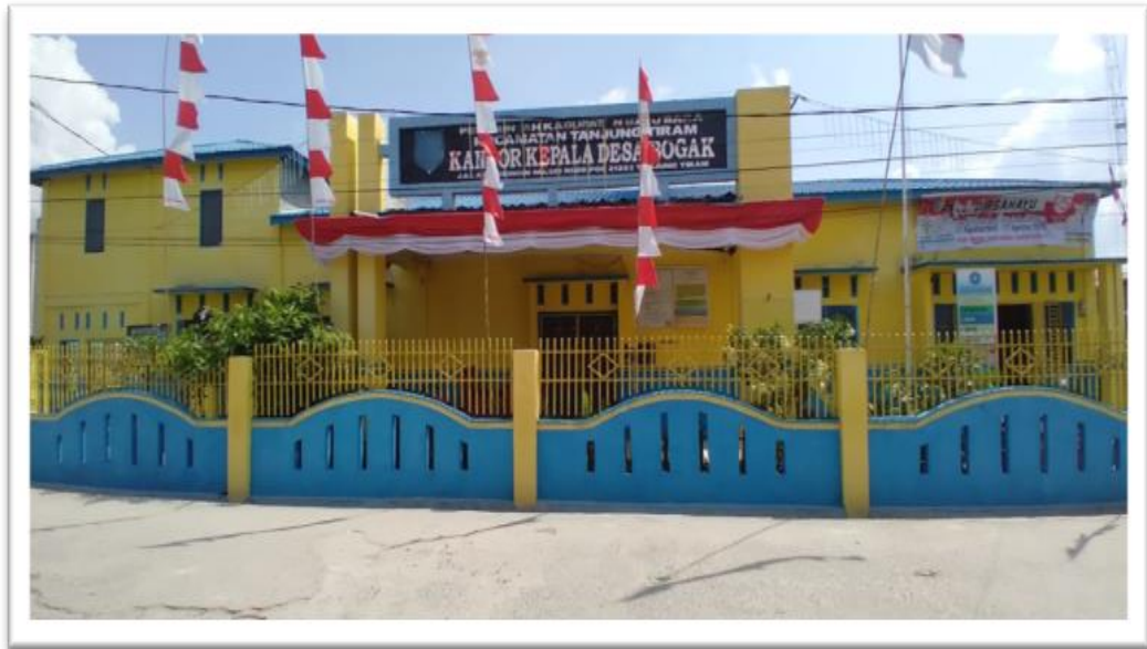
Kantor Kepala Desa Bogak