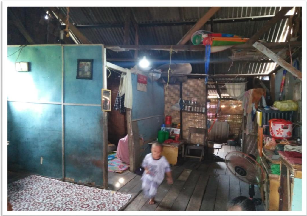
Rumah Nelayan Tradisional di Desa Bogak