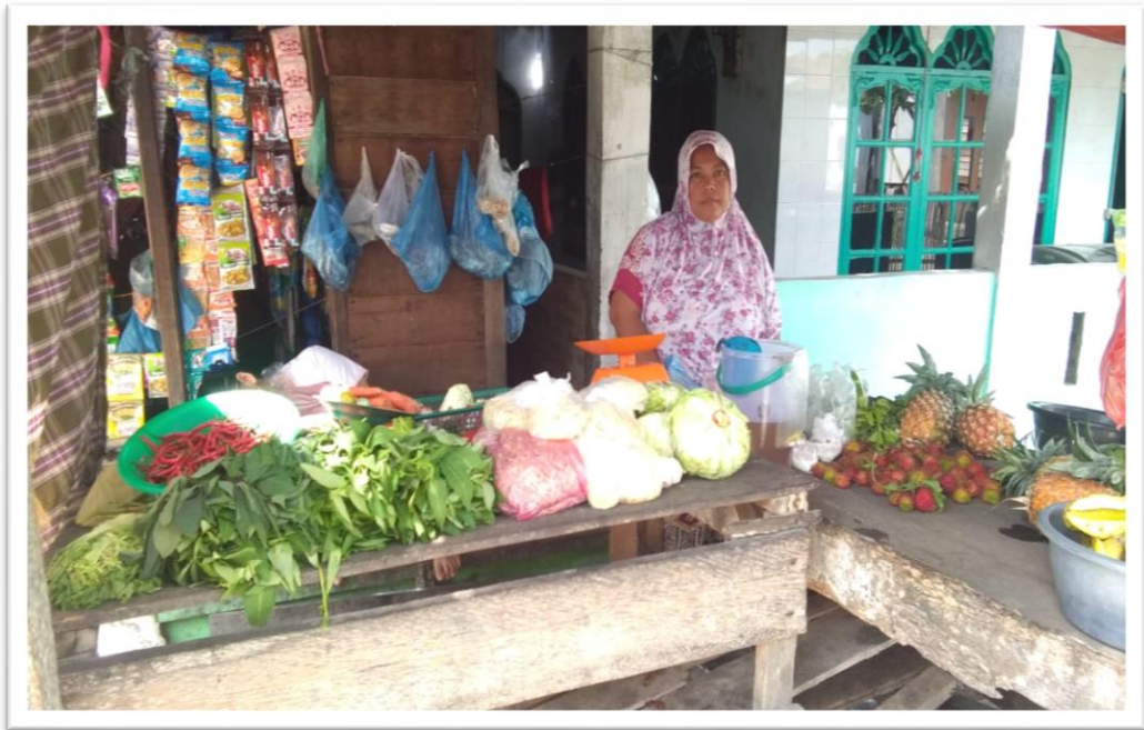
Usaha sampingan istri nelayan Desa Bogak