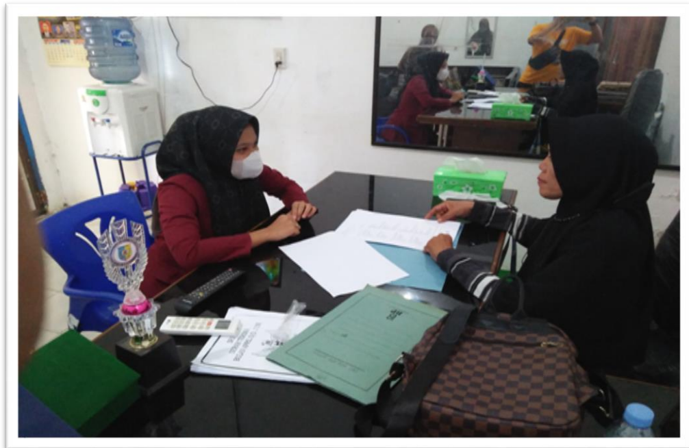
Wawancara dengan Kepala Desa Bogak Pada Tanggal 03 September 2022