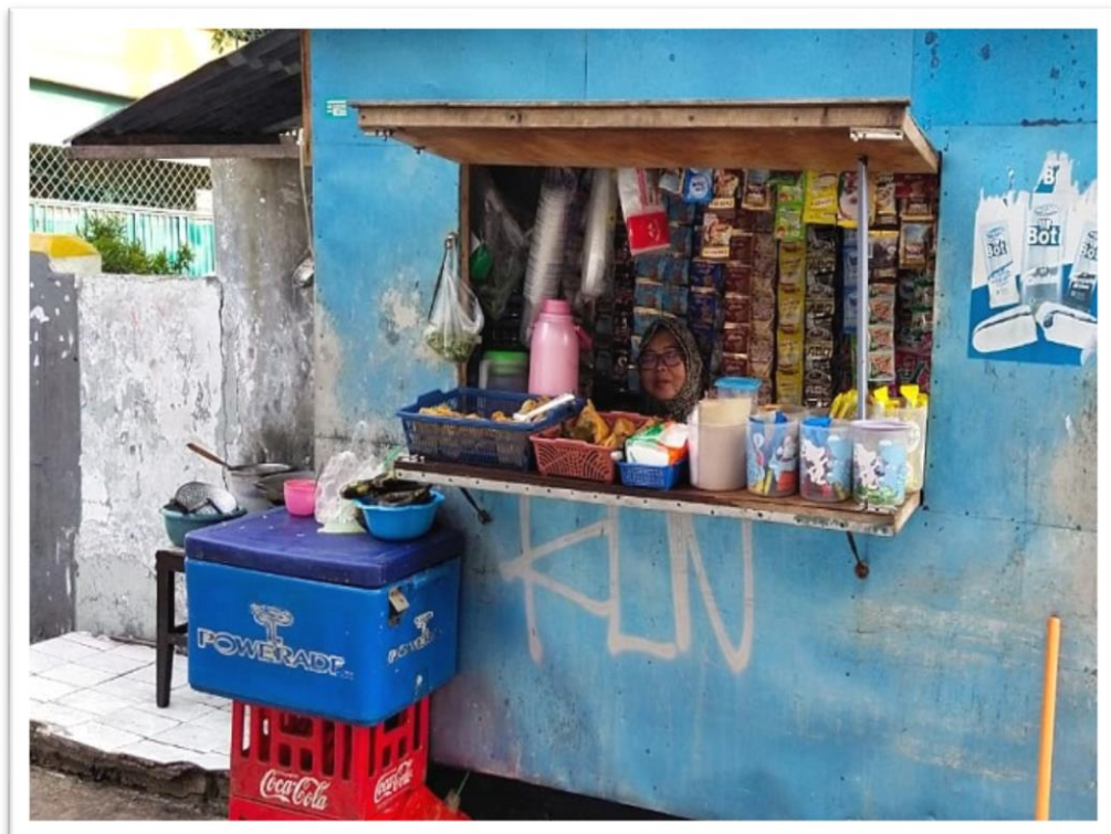
Usaha Istri Nelayan Tradisional Desa Bogak