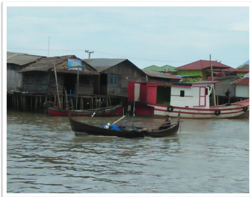
Nelayan Pulang Melau