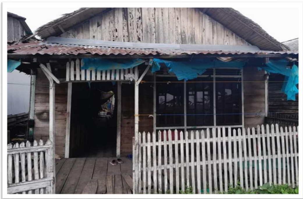
Rumah Nelayan Tradisional di Desa Bogak