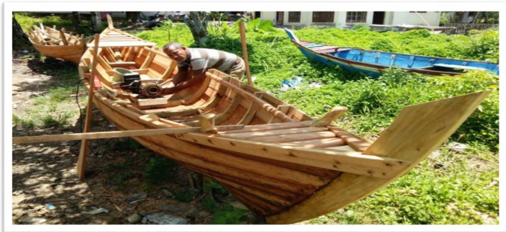
Kerja sampingan Nelaya membantu membuat kapal