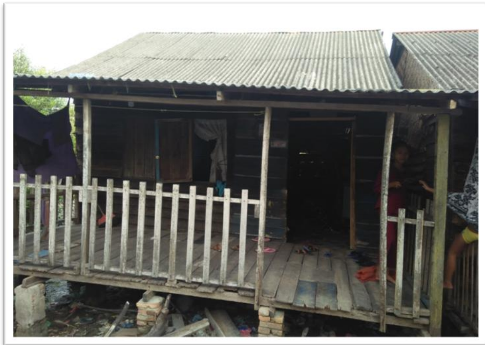
Rumah Nelayan Tradisional di Desa Bogak