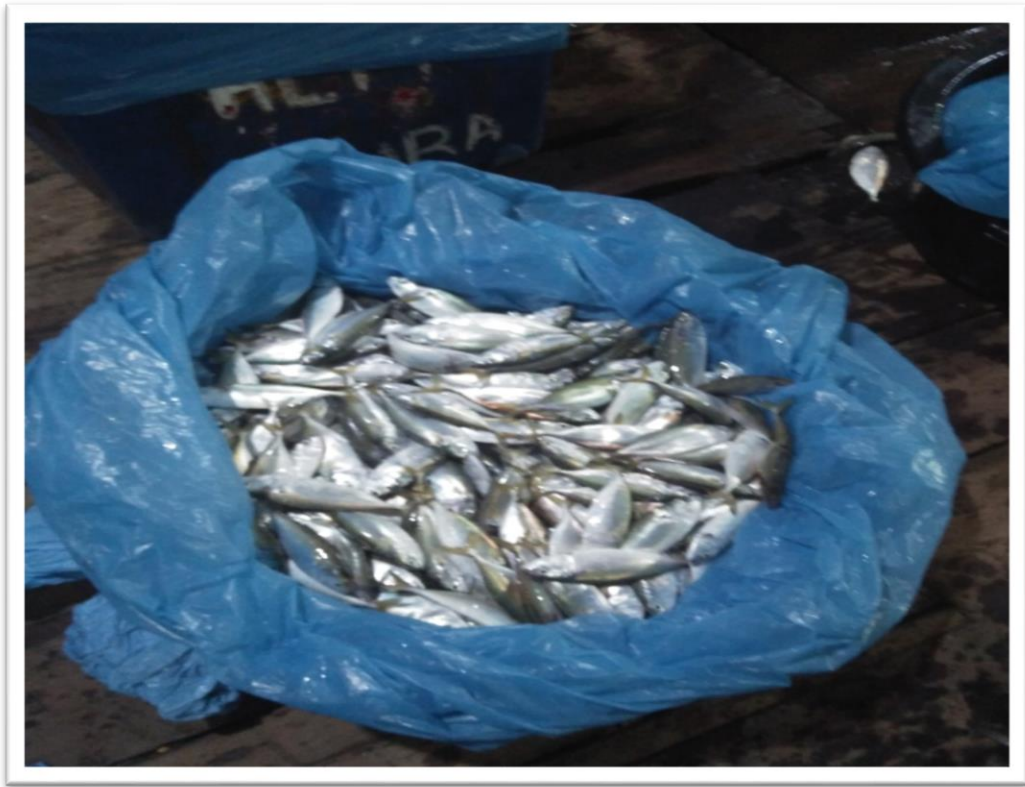
Hasil Tangkapan Nelayan