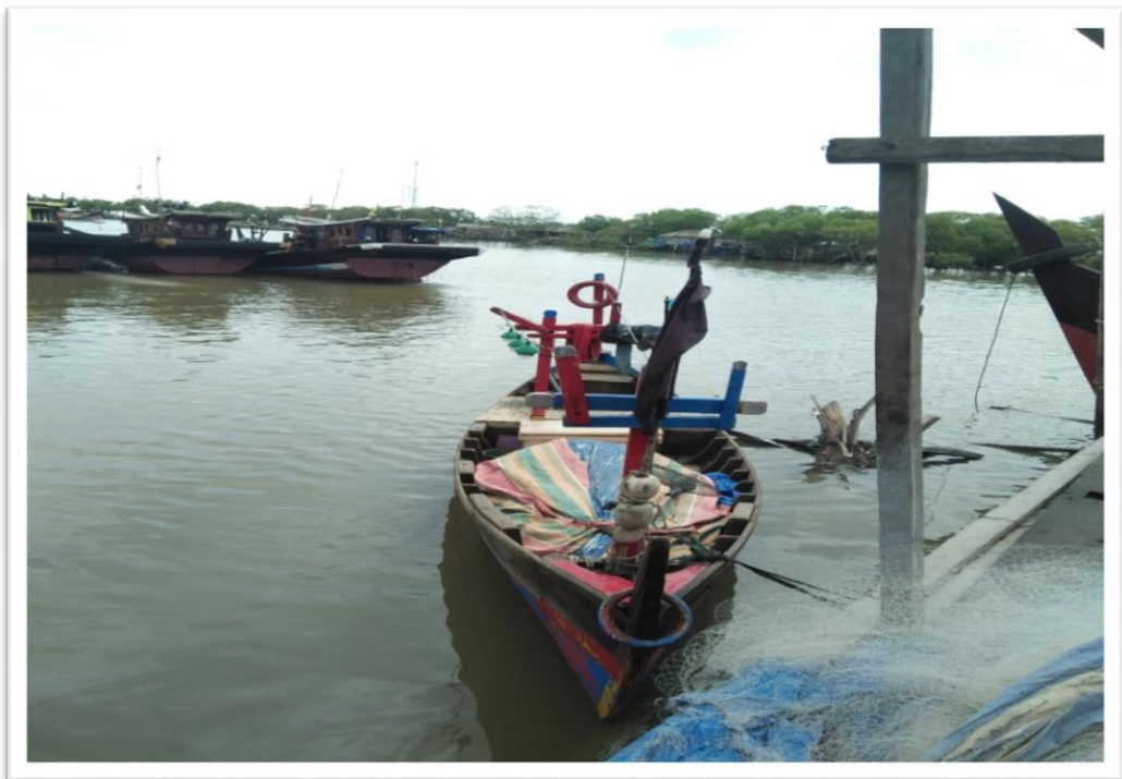
Perahu Nelayan Tradisional Desa Boga