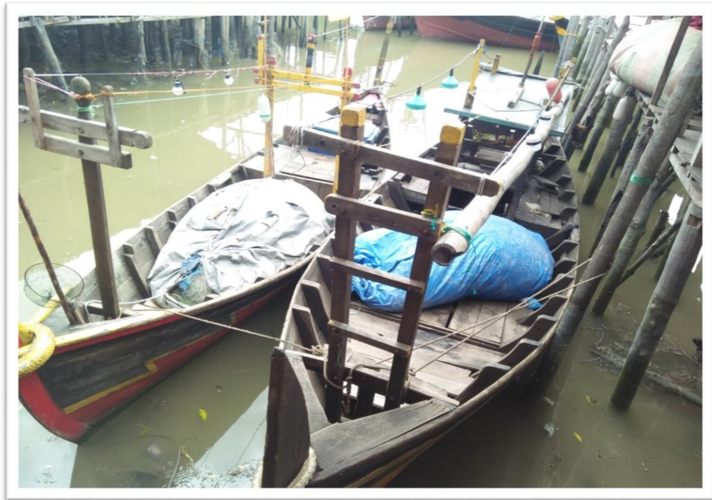
Perahu Nelayan Tradisional Desa Bogak