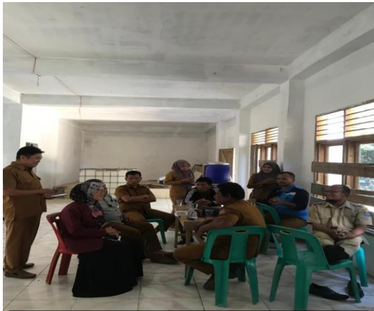
Diskusi dengan pengurus-pengurus 14 Dusun Tanjung Siram