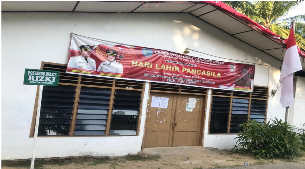
Kantor Kepala Desa Tanjung Siram