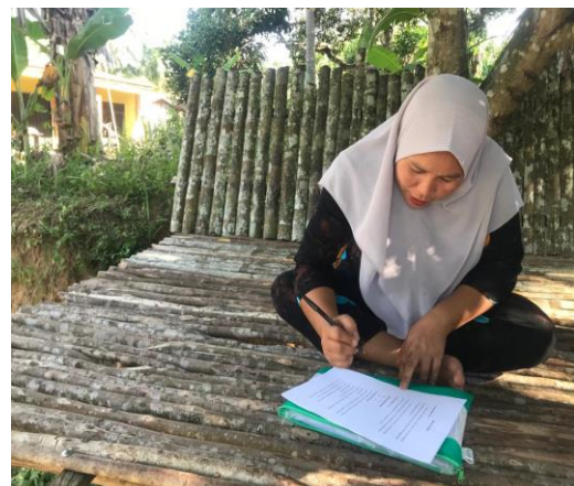
Pengisian Angket oleh Ibu Kia