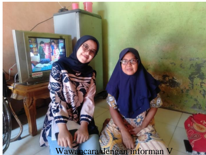
Wawancara dengan informan V Tamria (Masyarakat Melayu)