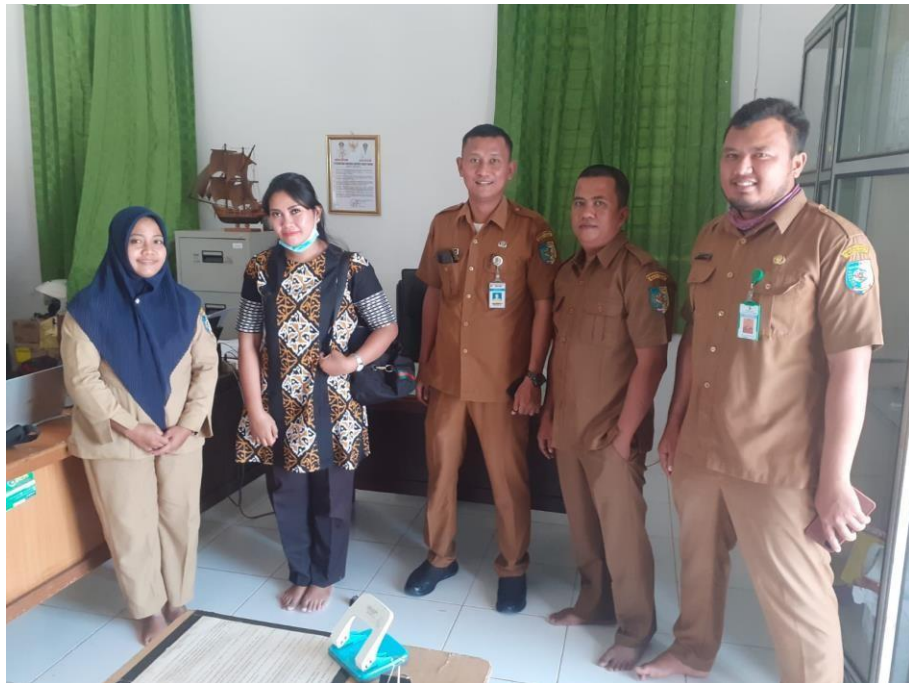
Peneliti melakukan foto bersama dengan para beberapa pegawai Dinas Kebudayaan & Pariwisata Kabupaten Batubara