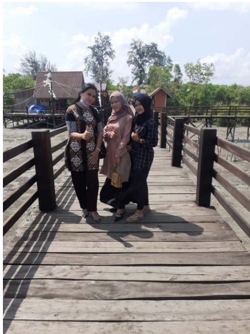
Peneliti sedang berfoto dengan beberapa pengunjung setelah melakukan wawancara singkat.