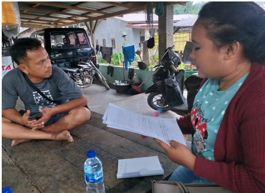
(wawancara dengan Kepala Desa Tanjung Raja)