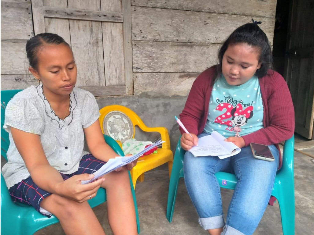
(wawancara dengan Kepala Dusun )