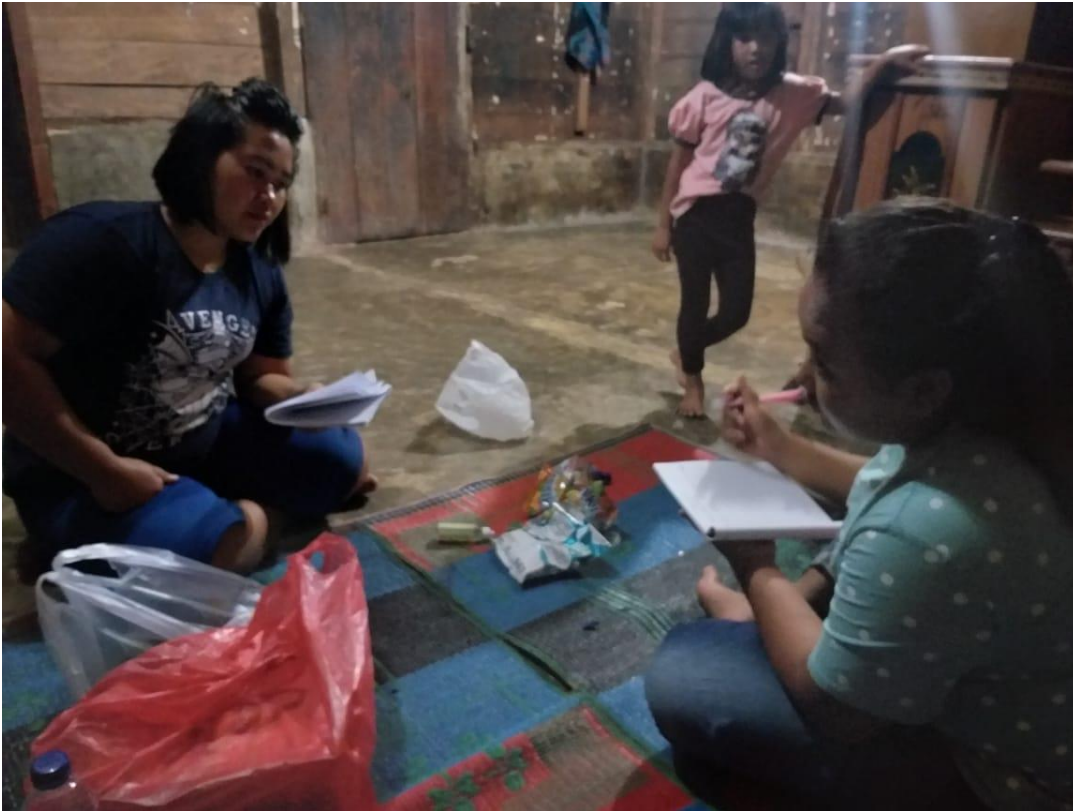
(wawancara dengan salah satu masyarakat Desa Tanjung Raja)