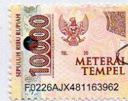
Tio Fanta Purba