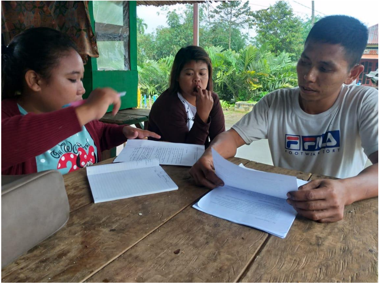
(wawancara dengan Kepala Urusan (Kaur) Kesejahteraan dan Kepala Urusan Pemerintahan)