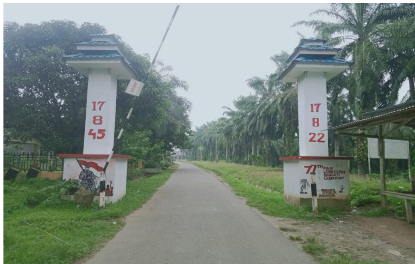
Gambar Pintu Masuk Desa