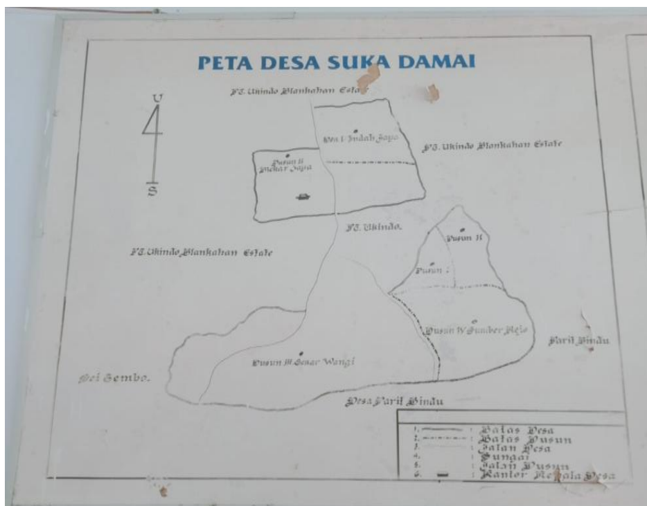
Gambar Peta Desa