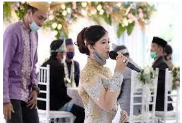
Foto Saat Kakak Memberi Nasehat Kepada Adik