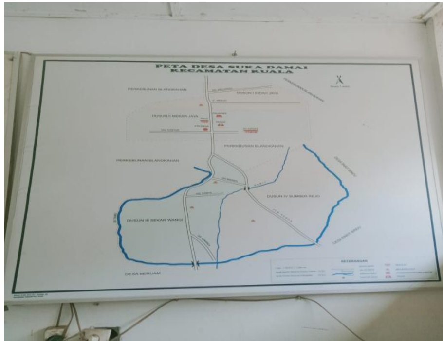
Gambar Denah Desa