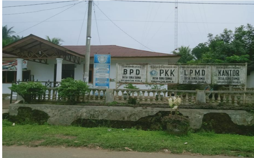
Gambar Kantor Desa