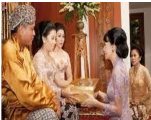
Foto Saat Sang Adik Memberikan Tanda Pemberian