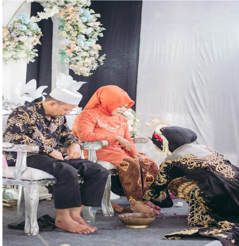
Foto Saat Sang Adik Mohon Restu Kakaknya