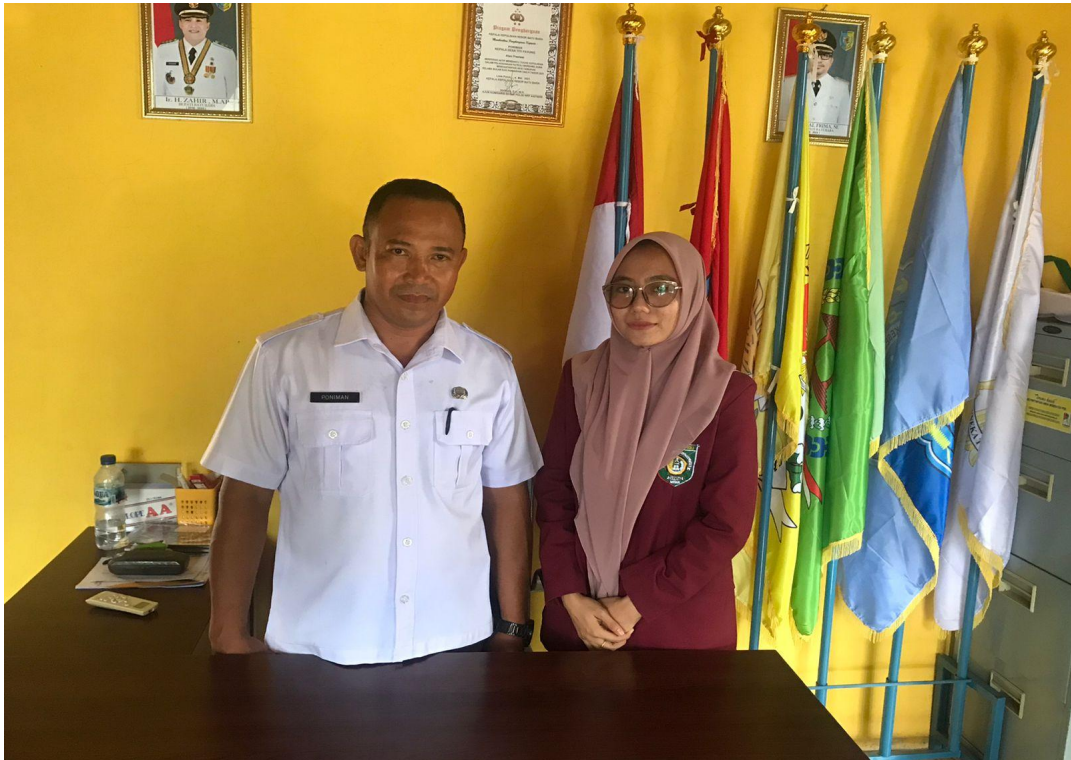
Dokumentasi Bersama Pemerintah Desa Titi Payung, Kec. Air Putih, Kab. Batu Bara, Provinsi Sumatera Utara