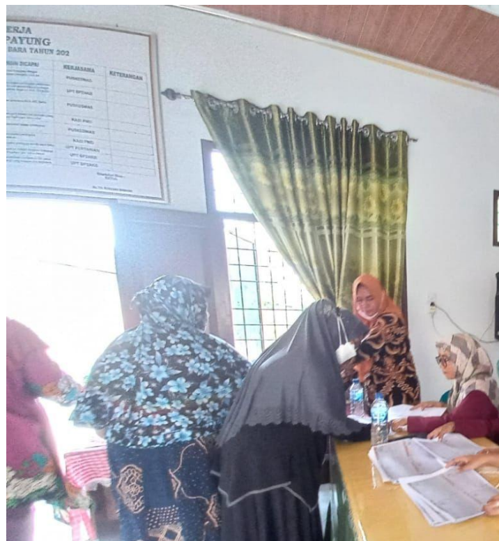
Dokumentasi Pembagian Program Batuan Desa Titi Payung, Kec. Air Putih, Kab. Batu Bara, Provinsi Sumatera Utara