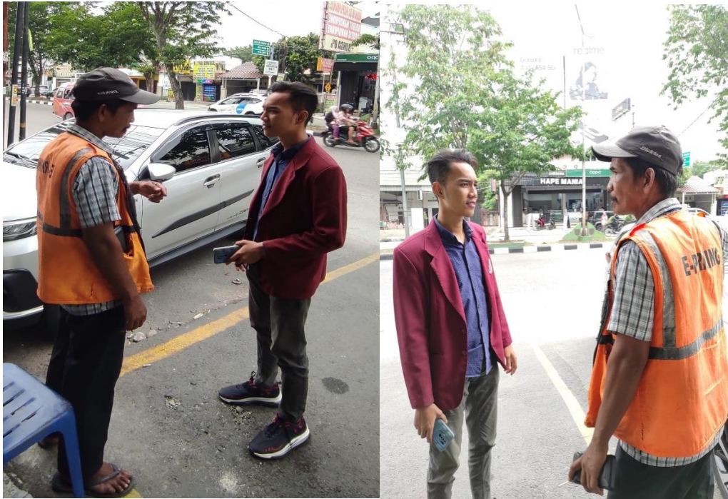
Foto Wawancara Dengan Jukir E-Parking Disamping UISU