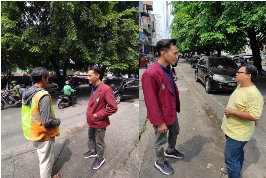
Foto Wawancara Dengan Jukir dan Pengguna E-Parking di Jl. Brig. Katamso