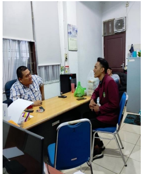
Foto Wawancara Dengan Kabid Perpajakan