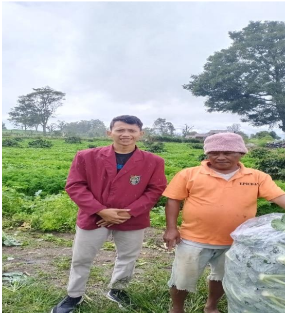
Gambar 4 kegiatan paska panen di gudang agen wortel