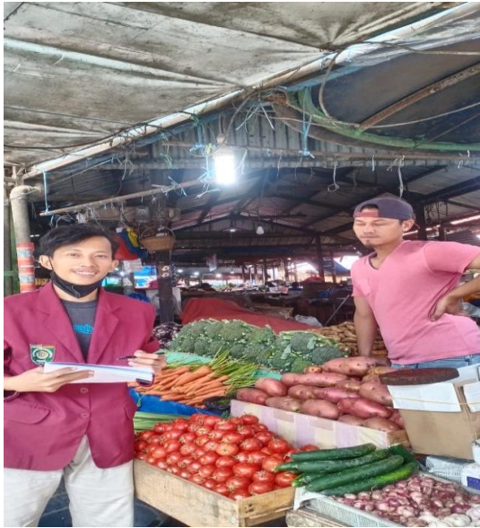
Gambar 2 foto bersama pedagang pengepul