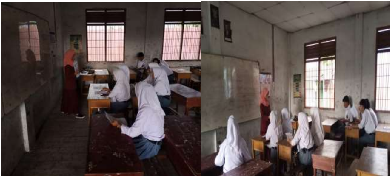
Gambar 2. Siswa sedang mengisi angket penilaian Modul menulis teks cerpen berbantuan Gambar Berseri untuk siswa kelas XI SMA/SMK