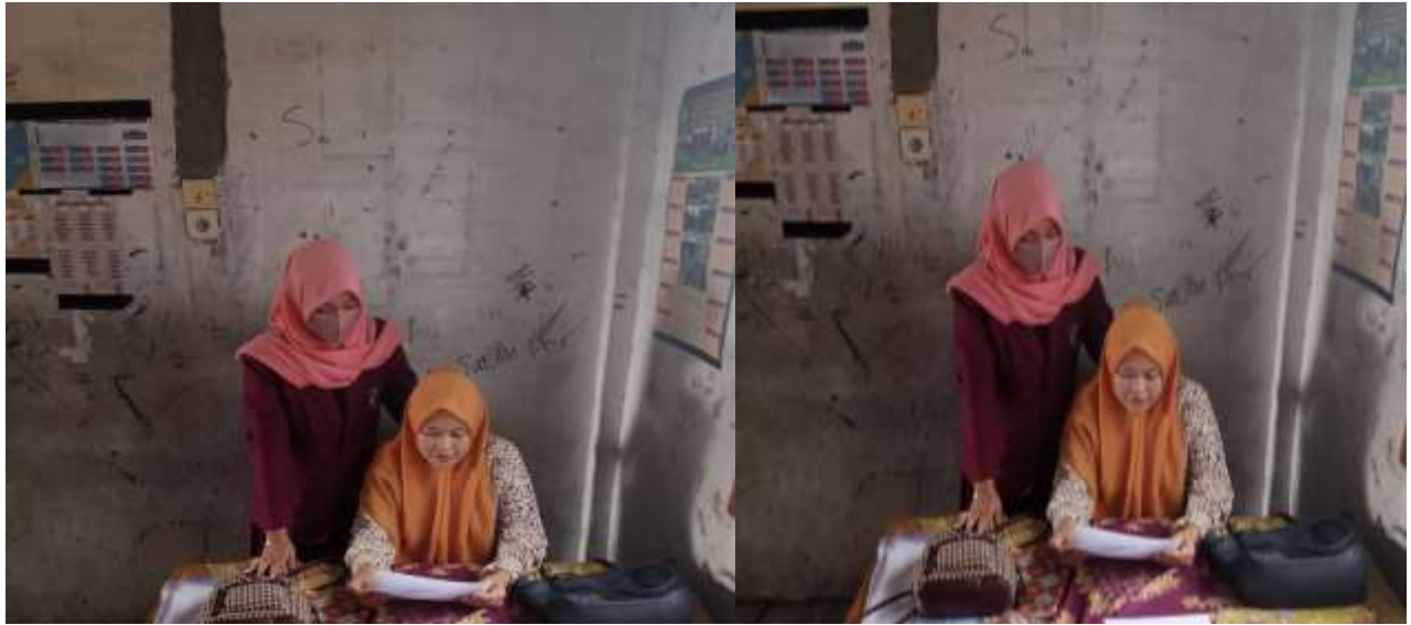
Gambar 3. Guru sedang mengisi angket penilaian Modul menulis teks cerpen berbantuan Gambar Berseri untuk siswa kelas XI SMA/SMK