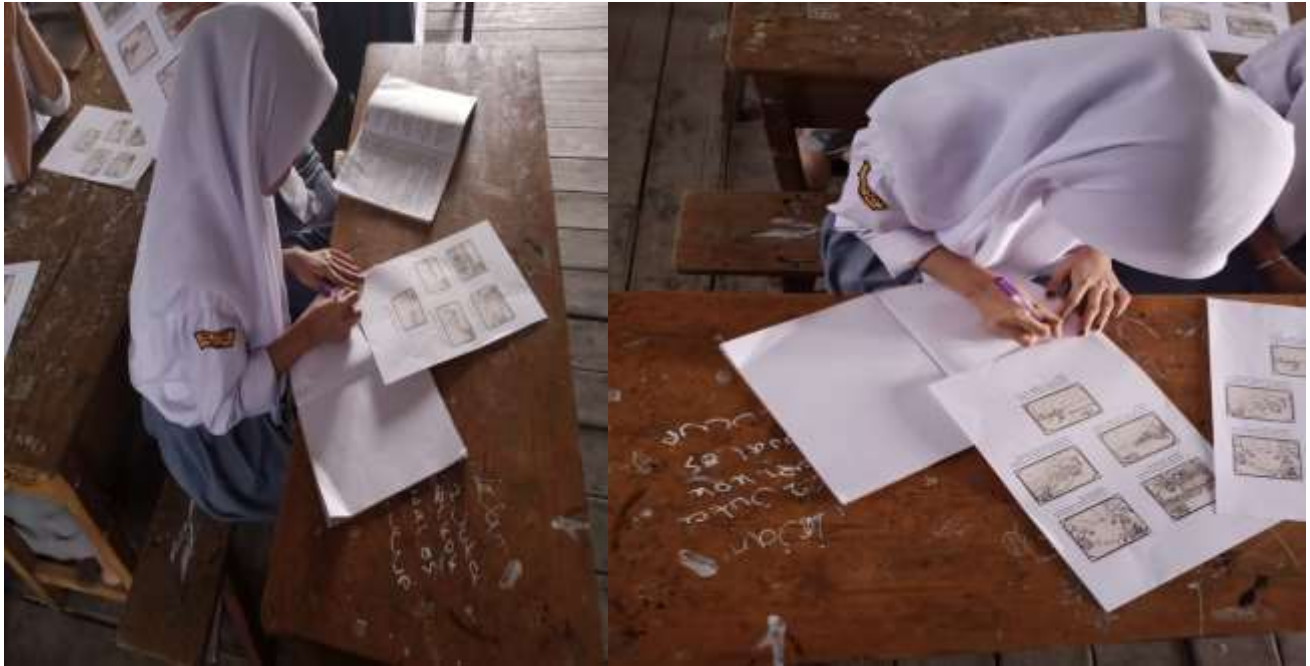
Gambar 1. Siswa sedang menulis cerpen menggunakan Gambar Berseri