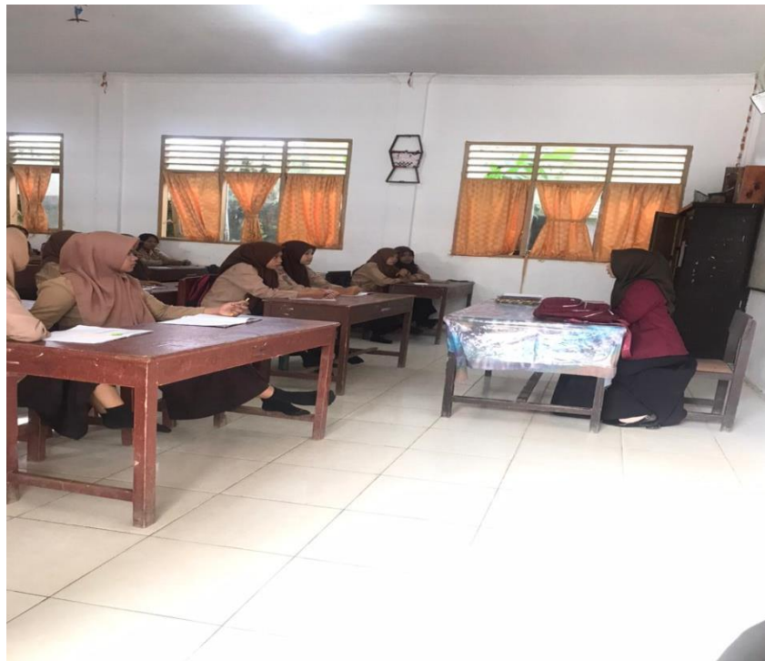
Gambar 17. Suasana proses pembelajaran