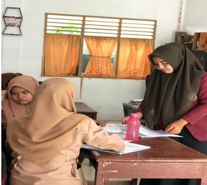
Gambar 18. Membagikan angket kepada siswa