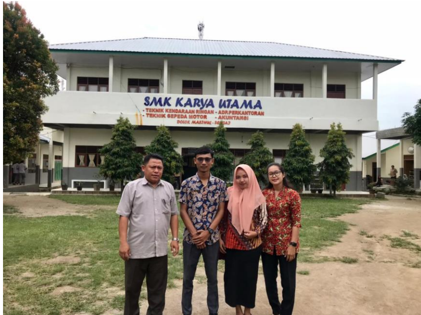
Gambar 16. Foto Bersama Kepala Sekolah dan Guru Bahasa Indonesia