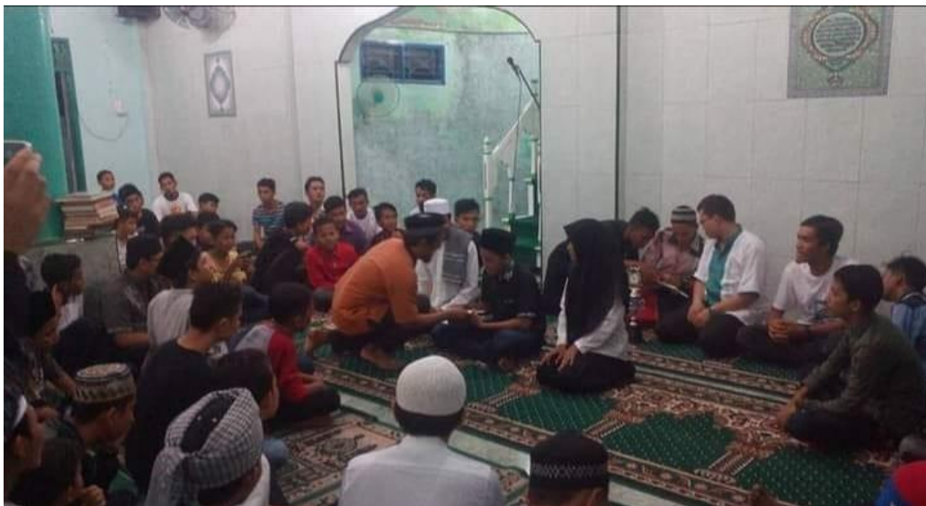
Gambar 2.5 RIMA