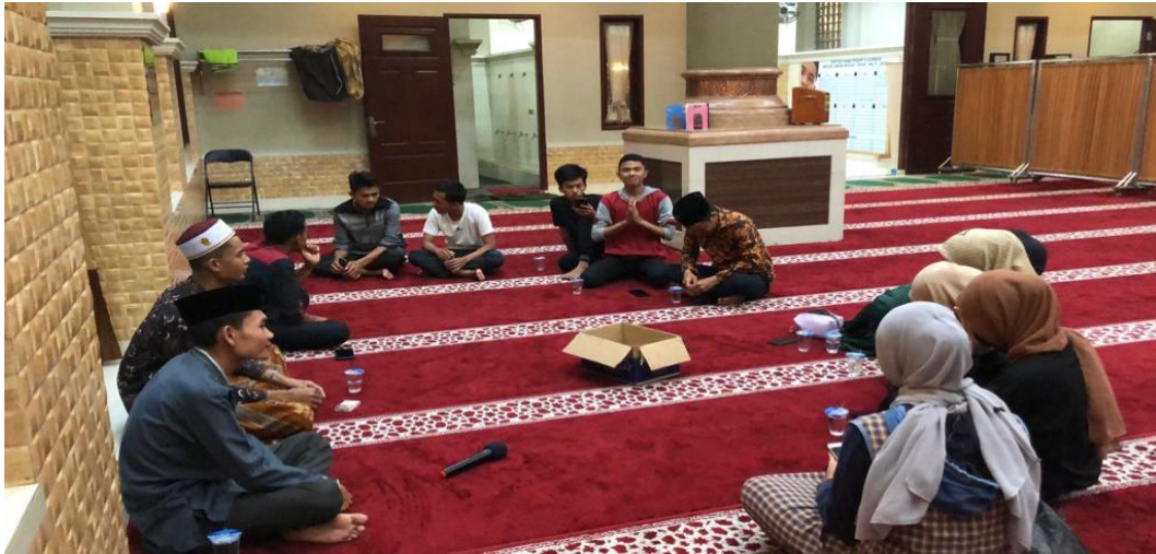
Gambar 2.4 IMMI

Nama : RIMA (Remaja Islam Masjid Ar-Rahman)