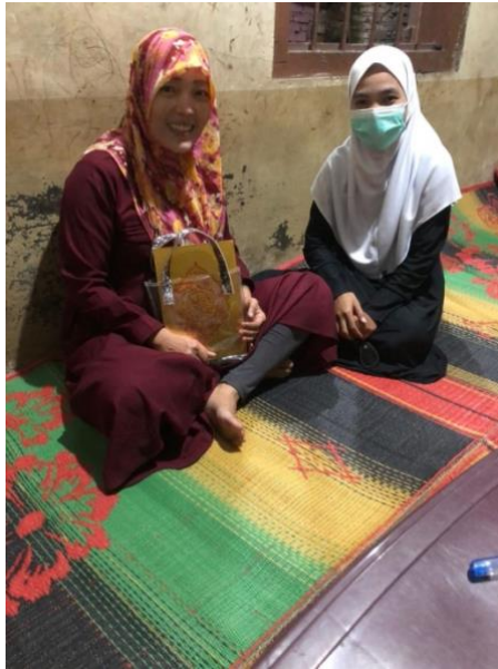
Gambar 1.9 Wawancara dengan Anggota Pengajian