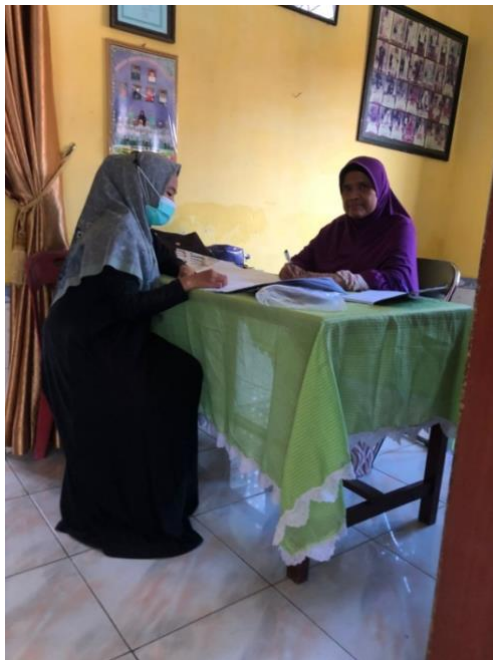
Gambar 2.1 Wawancara dengan Ketua Pengajian