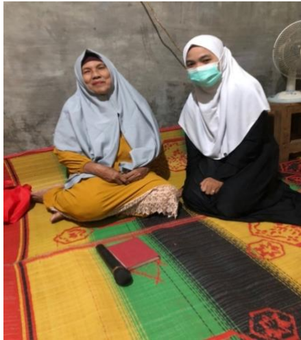
Gambar 1.7 Wawancara dengan Ketua Pengajian Ukhuatur rahmah