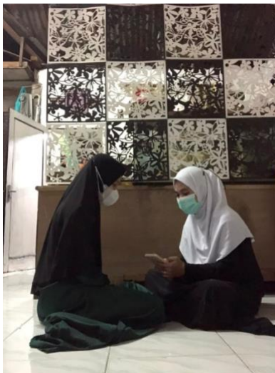
Gambar 1.5 Wawancara dengan Remaja Gg Setia sekaligus Rm Abidin