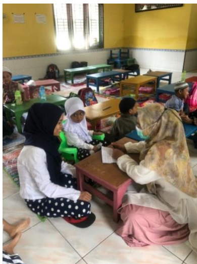
Gambar 2.3 Wawancara dengan Ibu pengajian Gg Kenangan