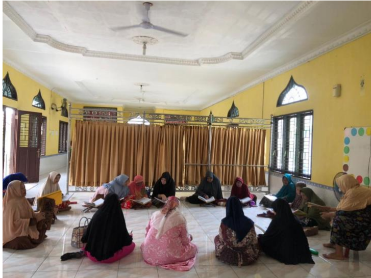
Gambar 2 Pengajian Gang Langgar