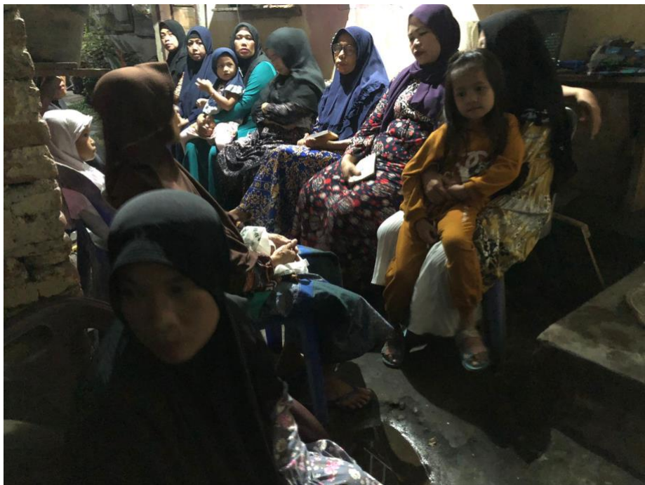
Gambar 1.6 Pengajian Ukhuatur rahmah