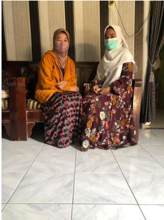
Gambar 2.4 Wawancara dengan Remaja pengajian Al-awwaliyah