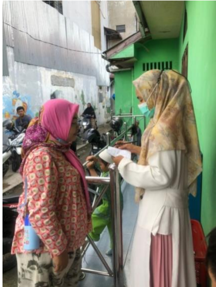
Gambar 2.2 Wawancara dengan Anggota Pengajian