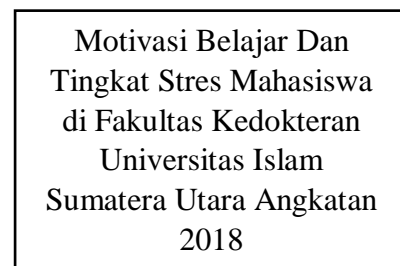
Gambar 2.2 Kerangka Konsep