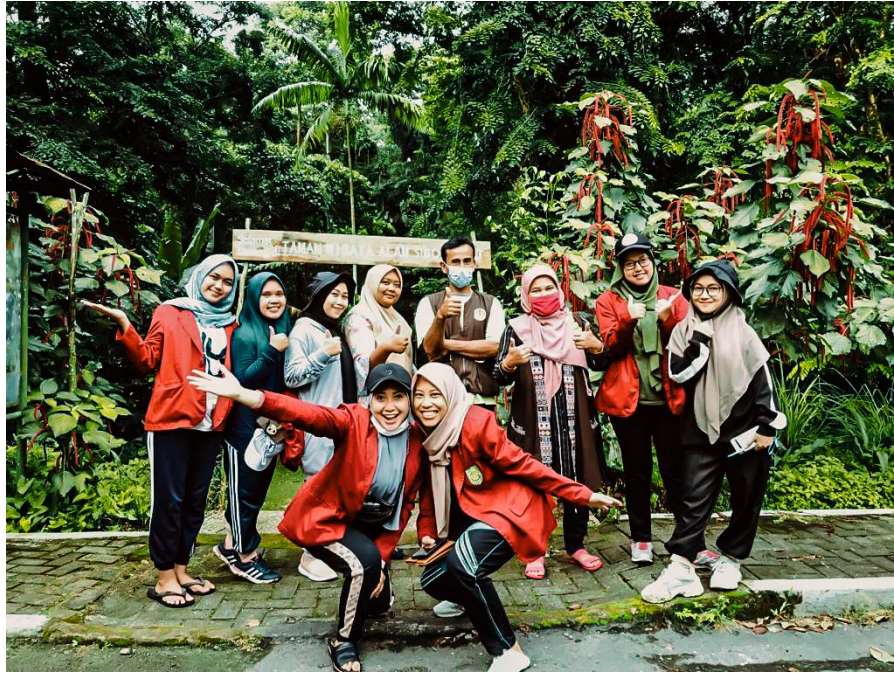
Foto Bersama Mahasiswa dan Tim Peneliti di Kawasan Taman Wisata Alam Sibolangit